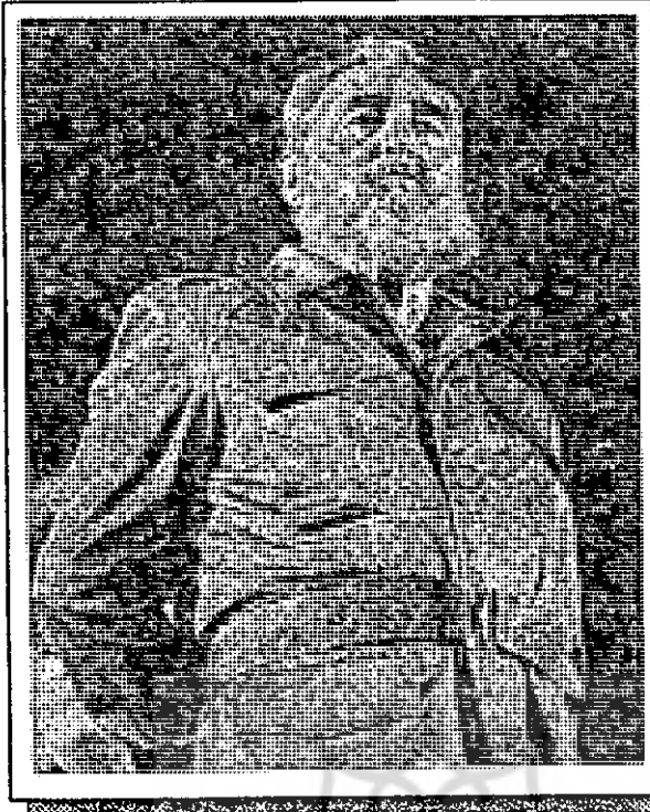
فیدل کاسترو، همچنان بر کوبا حکم می‌راند.

برای آن که دلارها از دست مردم کوبا خارج شود دو اقدام مهم انجام شد. یکی قانونی کردن داشتن دلار که مردم را قادر می‌ساخت برای اولین بار در تاریخ این کشور آن را آزادانه خرج کنند و دیگر، تأسیس مغازه‌های دولتی برای تبدیل پزو به دلار در سراسر کشور بود. در این مغازه‌ها که در واقع فروشگاه اجناس دلاری بود کوبایی‌ها می‌توانستند با دلار خرید کنند.