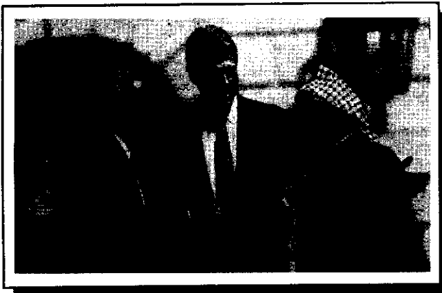
عرفات با رابین دست دوستی داد تا ۳۰ درصد از سرزمینهای ساحل غربی رود اردن را برای دولت خود گردان بگیرد، اما اکنون با ذبه در آوردن های ناتانیاها رو به رواست!