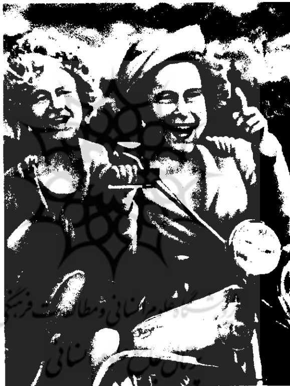
کاریکاتوری از ملکه الیزابت... پس از مرگ هروسش برای استراحت به بیلاقی می‌رود. این کاریکاتور در مطبوعات اروپائی چاپ شده است.

گزینش می‌باید باعث هوشیاری ساکنان کاخ‌های سلطنتی و بیرون راندن ارواح شاهان و سیاستمداران دوران گذشته از کاخ‌های می‌شد. اما دیوارهای این کاخ‌ها لظورتر از آن است که اجازه دهد ساکنانش تحولات بیرون را مشاهده کنند و با صدای اعتراض انگلیسی‌هایی را که پرنس چارلز را لایق ولایت عهدی نمی‌دانند و خواهان آندکه ویلیام - پسر چارلز