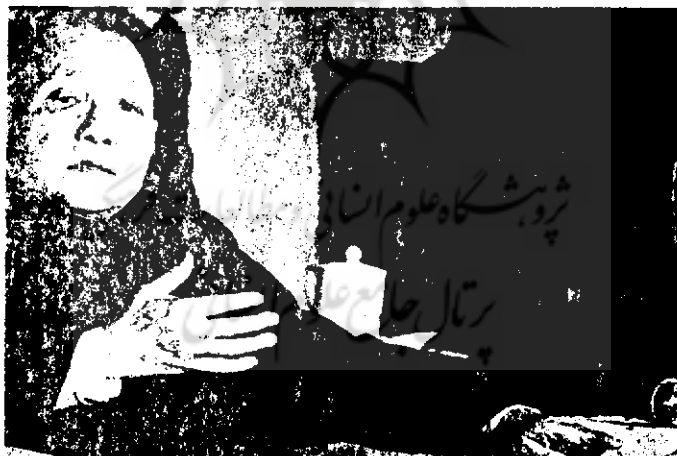
دنگ شیائوپینگ برای امپراطور بودن چیزی کم نداشته است

همین مقام ممکن است رهبر چین هفته‌ها یا ماهها در این حالت نباتی باقی بماند. هر زمان که مرگ رهبر فرا برسد هسته رهبری متشکل از رئیس‌جمهور و رهبر حزب کمونیست چین جیانگ زمین (Jiang zemin) ۶۸ ساله، نخست‌وزیر لی‌پنگ (Lipeng) ۶۶ ساله، آماده است تا جانشین رهبر فعلی گردد. جانشینان دنگ شیائوپینگ دیوان سالارهای ماهر، اصلاح‌گران محتاط‌میل به کت و شلوارهای غربی و چابک در حفظ بقای سیاسی هستند. اما تفاوت عمده‌شان با رهبر کنونی در عدم ایمان آنها به تحقق بهشت این دنیایی است. آنها حتی به حفظ شغل خود به