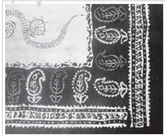
تصویر ۱۱: پارچه با نقش سرو خمیده، دوران قاجاریه.

نمونه پارچه‌های زیبای ایرانی با نقش بته یا درخت سرو را در پارچه‌ای در دوران قاجار می‌توان یافت. گفته می‌شود که این طرح در واقع مربوط به این دوران می‌باشد، که به صورت قطره اشک تصویر شده است. «تصویر ۱۱» «اما طرحی که در اصل مربوط به دوران قاجار باشد، طرح بته جقه (گل) با شکل مشخصه آن، قطره اشک و همچنین شامل ترسیم‌های متنوعی شبیه به میوه درخت کاج، درخت سرو، گل‌ابی، تاج درخت خرما، طرح اشک گونه‌ای از نام الله، جواهرات تاج شاه و غیره است. این طرح‌ها با شکل گیاهی که در اثر نسیم خم شده است بیش از پیش، سنتی‌تر می‌شوند. به موازات افزایش تزئینات موجود در آن حس حرکات گیاهی رخت بر می‌پندد. نگرشی کلی بر روی طرح، توجه انسان را موکداً از ساقه گیاه به سر آن منتقل می‌سازد و این گیاه‌گلدار را بیش از پیش مشابه با گل پیاز تازه جوانه زده، نشان می‌دهد.» (بیکر، ۱۳۸۵: ۱۴۰)