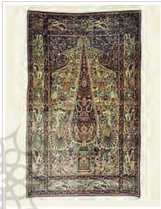
تصویر ۸: درخت سرو در قالی کرمان.

در مورد معنا و مفهومی که این نقش میتواند داشته باشد، به آرای متفاوتی بر می‌خوریم؛ زیرا این نقش به اشکال گوناگون و در مکان‌های مختلف همچنین در هنرهای متفاوت ایران زمین به چشم می‌خورد. حال اگر بخواهیم فلسفه و معنای این نقش زیبا را با توجه به تفکرات، عقاید، باورها و مذهب هنرمند خالق اثر مورد شناخت قرار دهیم، به نظر دور از دسترس می‌آید. «تصویر ۸»