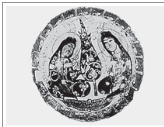
تصویر ۱۴: کاسه مینایی با نقش زن و مرد.

از مهم‌ترین نمونه‌های این نقوش می‌توان به تصویر زن و مرد در طرفین درخت سرو اشاره کرد. در برخی منابع از جمله کتاب "سفال و سفالگری در ایران"، این زن و مرد را لیلی و مجنون می‌دانند. این تصویر دارای مشخصات تصویرسازی دوران اسلامی است. هاله دور سر زن و مرد، حالات دست‌ها و مشخصات چهره همگی به قداست طرح کمک می‌کنند. درخت سروی که در میان آنها قرار دارد، می‌تواند اشاره‌ای به درخت زندگی داشته باشد و یا صفات جوانی، شادابی و پایداری دو شخص حاضر در این اثر را یادآور شود. (تصویر ۱۴)