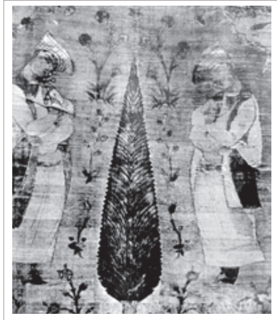
تصویر ۱۰: پارچه مخملی، اصفهان، اواخر قرن یازدهم هجری.

نمونه پارچه‌های زیبای ایرانی با نقش بته یا درخت سرو را در پارچه‌ای در دوران قاجار می‌توان یافت. گفته می‌شود که این طرح در واقع مربوط به این دوران می‌باشد، که به صورت قطره اشک تصویر شده است. «تصویر ۱۱» «اما طرحی که در اصل مربوط به دوران قاجار باشد، طرح بته جقه (گل) با شکل مشخصه آن، قطره اشک و همچنین شامل ترسیم‌های متنوعی شبیه به میوه درخت کاج، درخت سرو، گل‌ابی، تاج درخت خرما، طرح اشک گونه‌ای از نام الله، جواهرات تاج شاه و غیره است. این طرح‌ها با شکل گیاهی که در اثر نسیم خم شده است بیش از پیش، سنتی‌تر می‌شوند. به موازات افزایش تزئینات موجود در آن حس حرکات گیاهی رخت بر می‌پندد. نگرشی کلی بر روی طرح، توجه انسان را موکداً از ساقه گیاه به سر آن منتقل می‌سازد و این گیاه‌گلدار را بیش از پیش مشابه با گل پیاز تازه جوانه زده، نشان می‌دهد.» (بیکر، ۱۳۸۵: ۱۴۰)