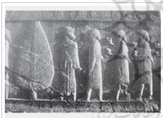
تصویر ۳: نقش سرو در پلکان شرقی کاخ آپادانا (تخت جمشید).

در این مورد بنظر می‌رسد اشاره به صفات سرو یعنی آزادگی و یا همان تقارن و هماهنگی در مورد نقوش انسانی دور از ذهن نباشد و القای این صفات را در مورد انسان یادآوری می‌کنند.