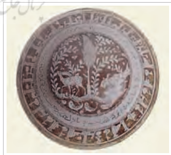
تصویر ۱۷: کاسه مخروطی با نقش حیوان و سرو، کاشان.

در نمونه‌ای از یک کاسه مخروطی متعلق به کاشان، همراهی نقش سرو با نقش حیوان مشهود است؛ «گودی داخل این کاسه با منظرهای نادر تزئین شده که پلنگی غزالی را پاورچین پاورچین تعقیب می‌کند؛ در مرکز کاسه درخت سروی در کنار نهری پر از ماهی به چشم می‌خورد. تنها قسمتی از بدن پلنگ ترسیم شده، استعاره تصویری پیچیده‌ای که در سفال کاشان ناشناخته است.» (تصویر ۱۷) (گروه، ۱۳۸۴، ۲۱۷)