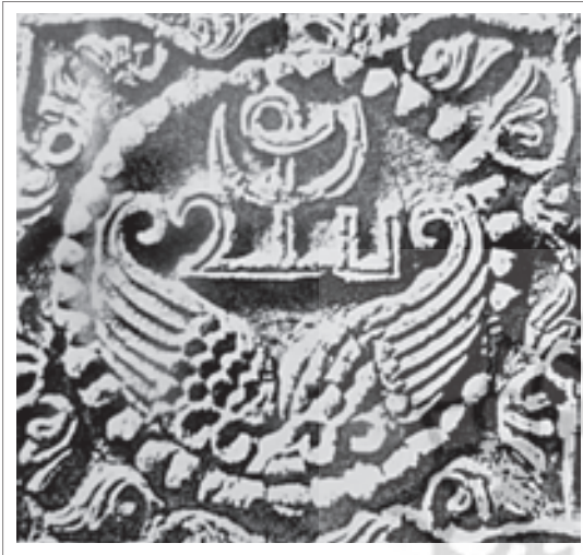
تصویر ۶: لوح کچبری تزئینی، بال‌ها شبیه به سرو، تیسفون.

می‌دانیم در واقع نقش "بته" تغییر شکل یافته درخت سرو می‌باشد که وارد هنرهای مختلف از جمله قالی شده و به این نام معروف گردیده است.