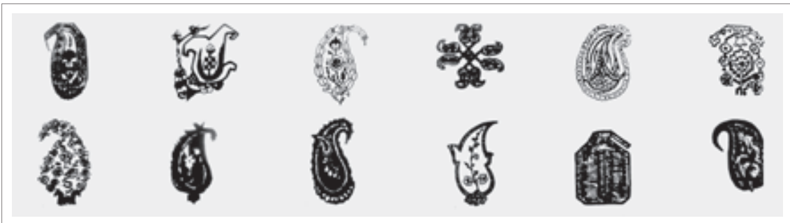
تصویر ۷: گونه‌های مختلفی از طرح بته که در فرش استفاده می‌شوند.

یکی از بسترهای مناسب و زیبا برای آفرینش نقش سرو، قالی می‌باشد. قالی مانند چمن‌زاری است که در بردارنده گل‌ها، درختان، حیوانات و سایر زیبایی‌های طبیعت می‌باشد. از جمله موتیف‌ها و طرح‌های زیبایی که در قالی ایران بسیار رایج است، نقش "بته جقه" است؛ همانطور که