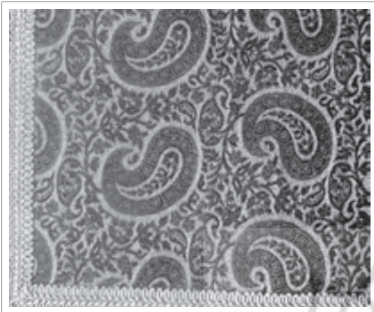
تصویر ۱۲: ترمه با طرح بته جقه.

ترمه از جمله پارچه‌های با ارزشی است که در آن بوفور از نقش سرو خمیده استفاده شده است که میراث دوران صفوی و قاجار می‌باشد و به صورت هدیه‌ای با ارزش بر روی جهیزیه دختران قرار داده می‌شده است و همواره مورد احترام بوده است. در ترمه از رنگ‌های اصیل و پخته استفاده می‌شود و طرح‌های آن اغلب نقوش گیاهی است که با نقش سرو خمیده ترکیب می‌شود. «تصویر ۱۲»