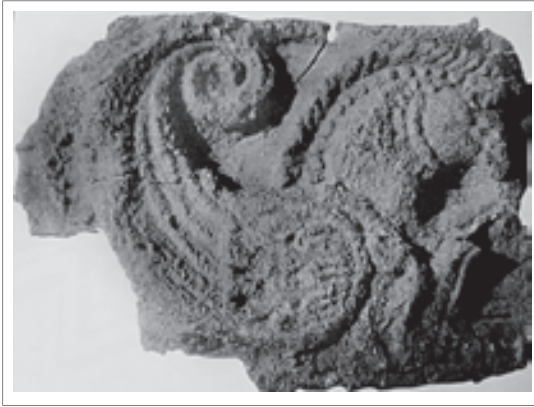
تصویر ۵: سرستون شیردال دیس با بال‌های شبیه به سرو، قلعه یزدگرد.