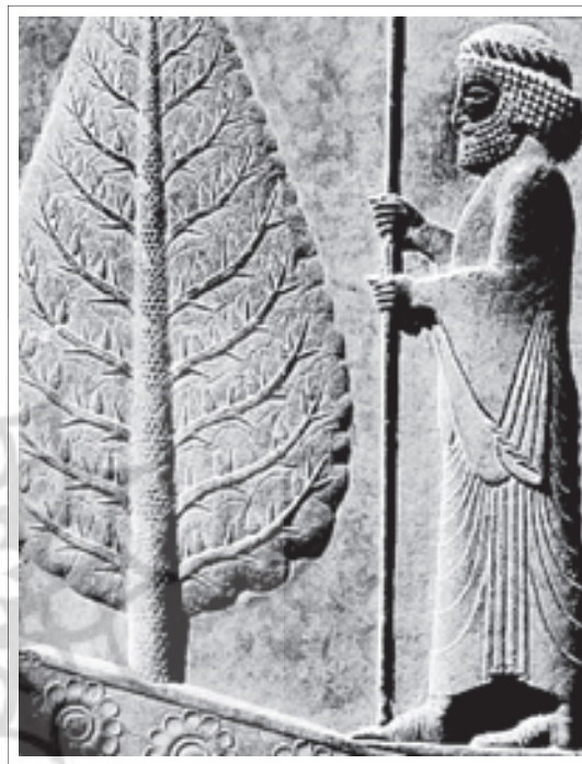
تصویر ۲: درخت سرو در سنگ‌نگاره‌های تخت جمشید.

و هر کسی میوه آن را بچشد جاودانه خواهد شد. درخت سرو درختی است همیشه سبز و تا حدودی جنبه مذهبی هم دارد. نمونه‌های از این درخت را می‌توان در زمان هخامنشی در بدنه پلکان‌های شرقی کاخ آپادانا تخت جمشید مشاهده نمود، زیرا در نظر ایرانیان باستان در آن زمان درخت سرو از اهمیت زیادی برخوردار بوده و سمبل گیاهی نامیده می‌شده است. (تصویر ۲) ضمن اینکه به درخت زندگی در میان مردم مشهور بوده است. (دادور و منصور، ۱۳۸۵، ۱۰۲)