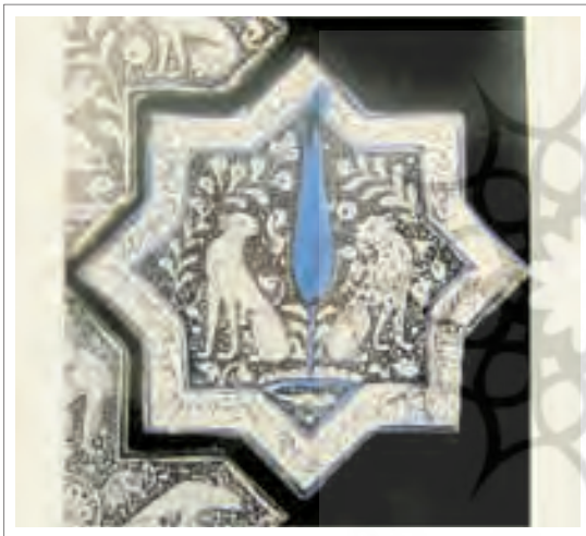
تصویر ۱۷: کاشی زربفام با نقش حیوان و سرو.

در کاشی‌های دوران اسلامی نیز می‌توان نقش سرو را همراه با نقوش حیوانی دید. «این کاشی‌ها شامل کاشی‌های پیکره‌های و غیر پیکره‌های بودند. از آنجایی که این احتمال وجود دارد که کاشی‌های پیکره‌ای عمدتاً برای استفاده غیر دینی اختصاص و کاشی‌های بدون پیکره برای موقعیت‌های مذهبی در نظر گرفته می‌شده. اما این مسأله روشن است که تعدادی از کاشی‌های پیکره‌های در مقبره‌های شیعی مورد استفاده قرار می‌گرفتند.» (پورتر، ۱۳۸۰، ۳۶) بر روی یکی از کاشی‌های هشت پر ستاره‌ای و چلیپایی زرین فام متعلق به کاشان نقش سرو را در کنار نقش دو حیوان گربه‌سان به تصویر کشیده‌اند. (تصویر ۱۸) در اطراف این کاشی‌ها اشعاری از شاهنامه به خط نسخ نوشته شده است. این کاشی زمانی متعلق به امامزاده جعفر در دامغان بوده (۴)، گرچه به گفته خانم پورتر به تصویر کشیدن زندگی در اماکن مذهبی مرسوم نبوده است.