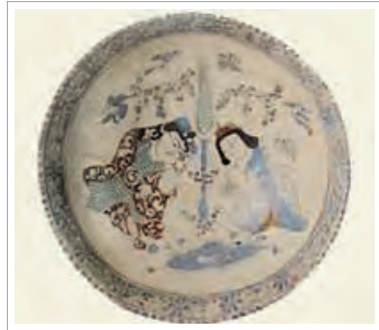
تصویر ۱۶: کاسه مینایی با نقش انسان و سرو.

می‌باشد که بسیار تنک و نازک است که حالت اندوه این صحنه را بیشتر می‌کند. (تصویر ۱۶)