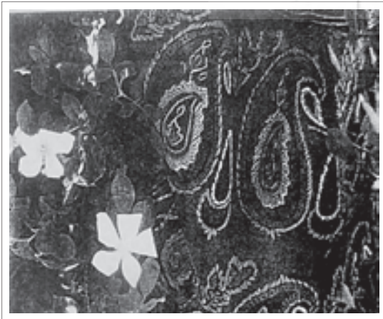
تصویر ۱۳: پته با نقش بته جقه.

پته دوزی نوعی سوزن‌دوزی بر روی پارچه می‌باشد و بیشتر در کرمان انجام می‌شود. «در این هنر، طرح شامل دو بخش حاشیه و زمینه است. نقش‌های طرح حاشیه پته‌ها عبارتند از: خط‌های مستقیم، انواع گل‌ها، شکل‌های هندسی مانند مثلث، مربع، مستطیل و خط‌های شکسته: ختایی، طوماری، بادامی و سروچه. نقش‌های طرح زمینه پته‌ها عبارتند از: ترنج بته جقه یا درخت زندگی، درختی، سرو، گل‌های بادامی بزرگ و گاهی نقش‌های حیوانات و پرندگان. گل‌های بادامی را بیشتر در چهارگوشه پارچه در می‌آورند.» (عطروش، ۱۳۸۵: ۱۲) «تصویر ۱۳»