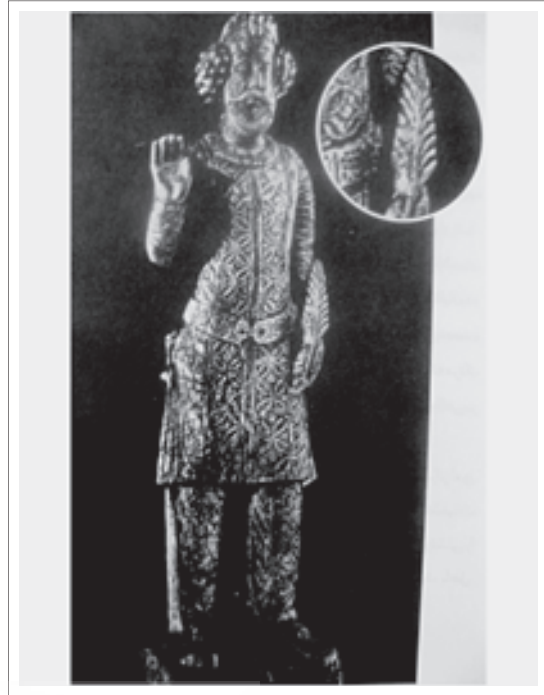
تصویر ۴: مجسمه اشک دهم اشکانی با شیئی شبیه به سرو در دست.

«شکل بته در طرح‌های فرش به گونه‌ها و اندازه‌های مختلف به چشم می‌خورد. (تصویر ۷) گاهی چنان بزرگ که چندتایی از آن برای پوشش سطح فرش کفایت می‌کند ولی در بیشتر موارد به اندازه‌های کوچک در ردیف‌های موازی در متن فرش و یا به دنبال یکدیگر در حاشیه قالی دیده می‌شوند. گاهی در سبک شاخه شکسته ولی اغلب در سبک منحنی به سر انگشت طراح می‌آید» (بصری، ۱۳۸۲، ۴۴).