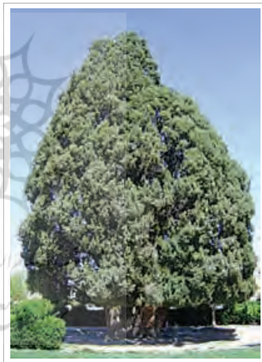
تصویر ۱: سرو چهار هزارساله ابرقو (ابرقو).

زردشت این درخت را از بهشت آورد و در پیش در آتشکده کاشت (سرو کاشمر). (عطروش، ۱۳۸۵، ۳۴ و ۳۵) در ایران به دلیل قداستی که برای درخت، بخصوص درخت سرو قائل می‌باشند، از بریدن و قطع کردن این درخت زیبا جلوگیری می‌شود و در جای جای شهرها می‌بینیم که برای زیبایی هر چه بیشتر از آن استفاده می‌شود؛ تا جاییکه تعدادی از این درختان هستند که قداستی چند هزار ساله یافته‌اند و به دلیل تقدس و روحانیتی که دارند، از قطع کردن آنها جلوگیری می‌شده است. (یکی از نمونه‌های این درخت زیبا سرو مشهور ابرقو می‌باشد. (تصویر ۱) این سرو در بین مردم تا حدی از وجه تقدس برخوردار است، که اگر از نزدیک آن را مشاهده کنید پارچه‌ها و نخهایی دیده می‌شود که مردم به قصد تبرک و به دلایل مذهبی دیگر به شاخه‌های آن بسته‌اند و این، ریشه در تاریخ کهن این دیار دارد. (همان، ۳۵)