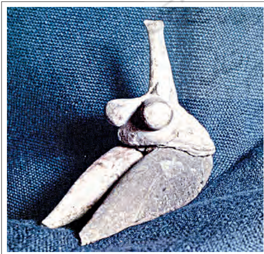
تصویر ۱: ونوس تپه‌سراب، ارتفاع ۱۵/۶ سانتی‌متر، دوران نوسنگی (هزاره ششم پیش از میلاد)، موزه ملی ایران

انسان‌شناسی دانشگاه شرقی شیکاگو به سرپرستی رابرت بریدوود (Robert Braidwood)، در تپه سراب، از اراضی کرمانشاه کشف گردیدند و متعلق به ۶۰۰۰ سال قبل از میلاد است و به گفته ایدت پرادا، به گونه‌ای مؤثر و شاید دلپذیر، بیان یک اندیشه را آشکار می‌سازند (تصویر ۱).