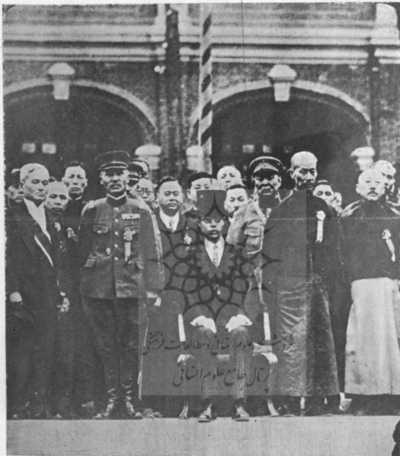
امپراتور سابق چین هان تنگک ( با کلاه سلیندر ) برقراری خودش را برپاست حکومت جدید منچوریا اعلان می نماید در صف اول طرف چپ شاه شخص دوم : جنرال جاپانی ( هانجو ) و شخصیکه در اخیر سمت چپ مشاهده میشود کنت پوشی وای جاپانی میباشد . نصب و برقراری « هانگک تنگک » امپراتور خورد سال سابق چین برپاست حکومت جدید منچوریا در ( چانگک چن ) پایتخت جدید در حضور کنت یوتی وا ( وزیر خارجه سابق جاپان و رئیس راه آهن جنوب منچوریا ) و جنرال ( هانجو ) ( قوماندان قوای جاپان در منچوری ) در ۹ ماه مارچ بوقوع پیوست .