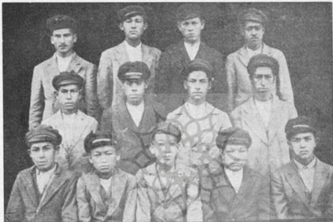
شوشگاه علوم انسانی و مطالعات فرهنگی معلمین شعبه افزار سازی مکتب باغابکی

مستقل اندمگر تا وقتیکه وزارت معارف عمارت ' پروگرام ' عملة آنها را که برای امور عرفانی و تعلیم آنها ضرورت منظور نکند، مؤسسات مذکور افتتاح شده نمی تواند.