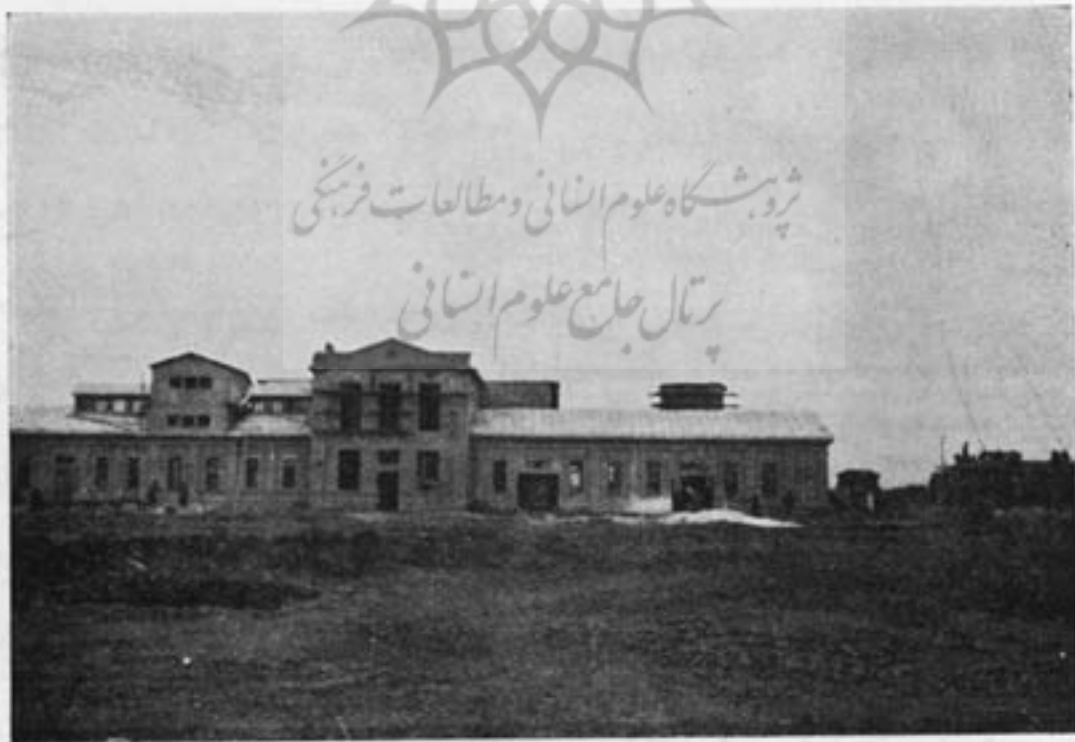
منظره شمالی فابریکه پنبه روتک قسمت از عمارات الحاقیه آن متعلق مقاله افغانستان شماره گذشته