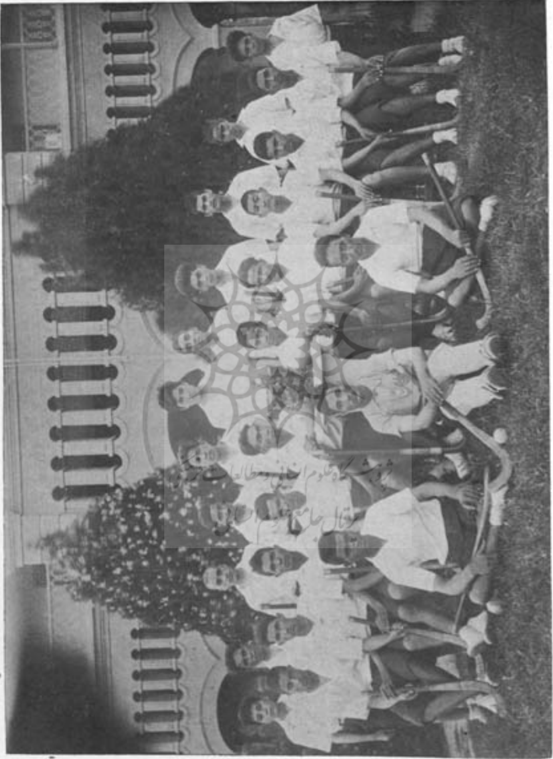
ٹیم ہاکی مکتبہ حبیبہ متعلق شہرہ ۱۲ سال ۵ - ۵ آئیے