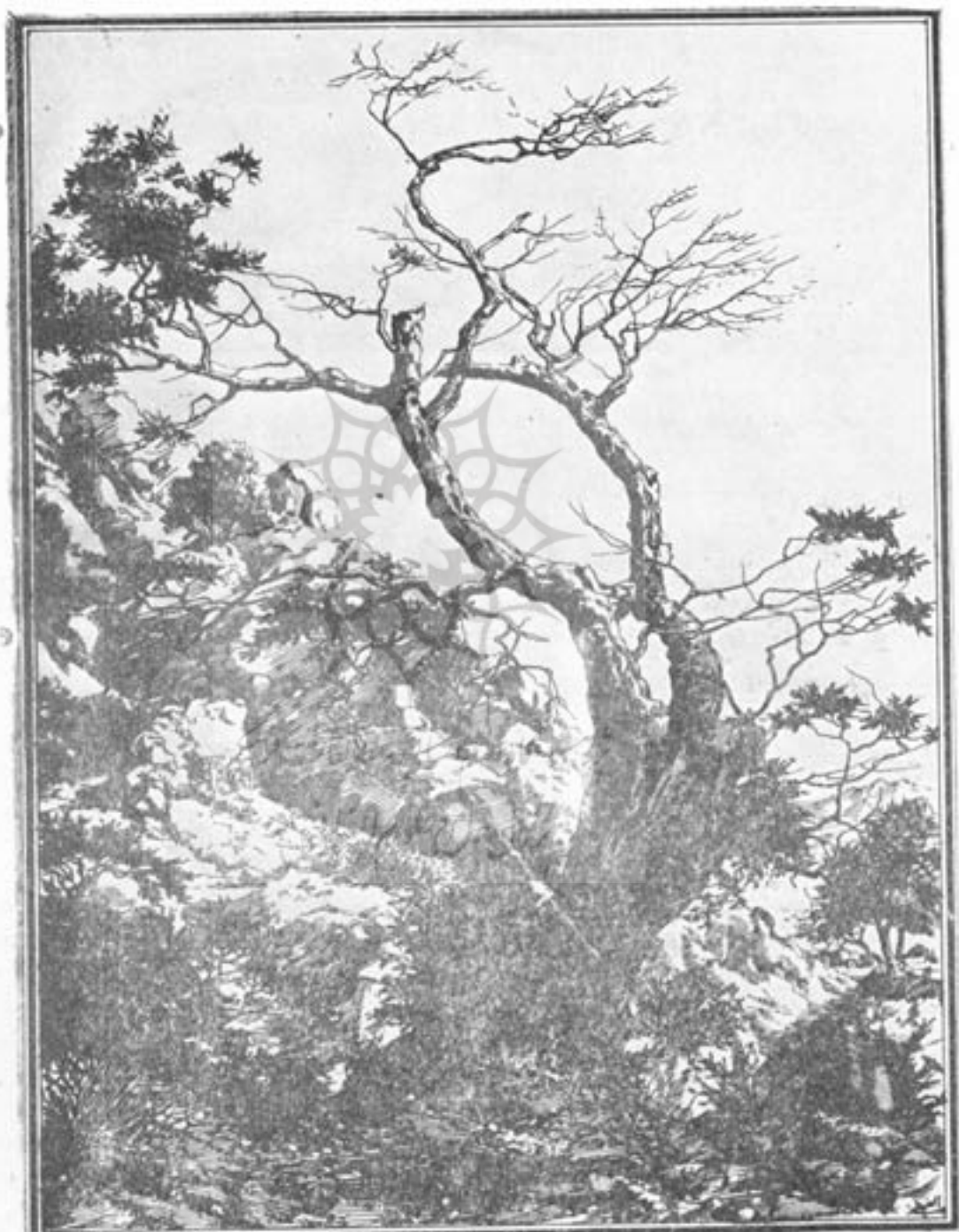
دسته کوه خواجه صنای کابل - ۱۳۱۳