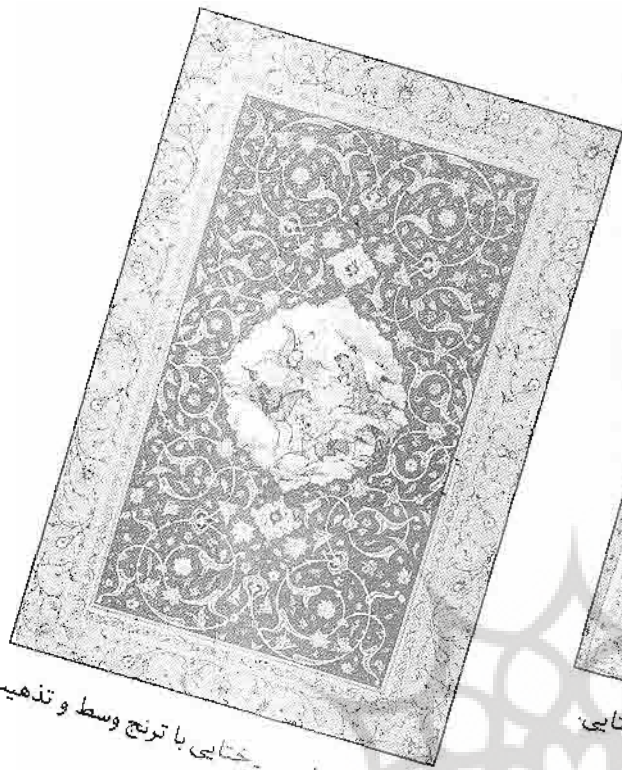
قالی طرح اسلیمی - ختایی با ترنج وسط و تذهیب حاشیه با گل و بوته