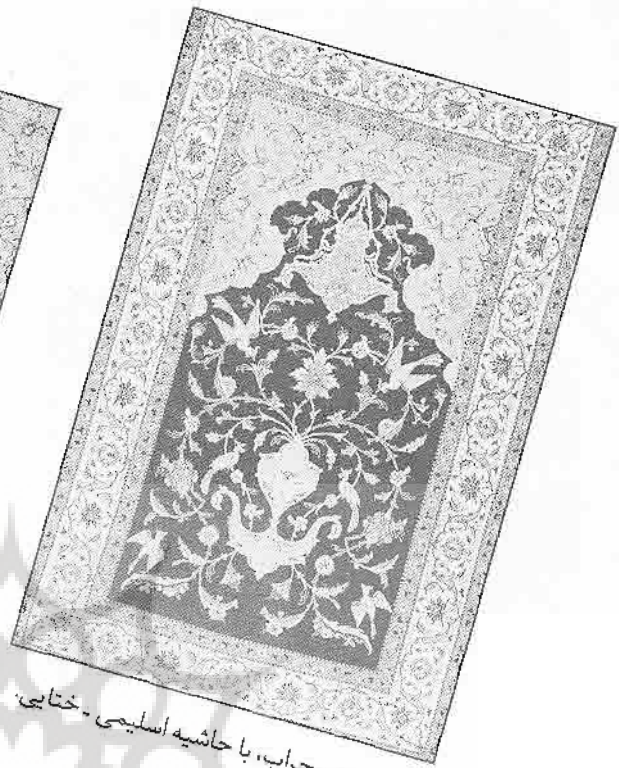
قالی طرح محراب، با حاشیه اسلیمی - ختایی.

فرش بافی ایلات و از جمله فرش های ترکمنی، ذهنی بافت است و نگاره های آن نقش هایی است هندسی منتزع از محیط، (مثل گل و گیاه و پرند) ابزار کار و وسایل زندگی که در ترکیب با هم دیده می شود.