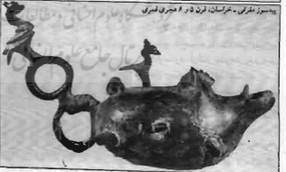
پیموسوز مغربی - خراسان، قرن ۵ و ۶ هجری قمری