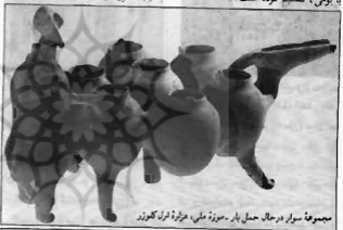
مجموعه سوار در حال حمل بار - موزه ملی، هزاره اولی کلوزر

«هر موزه‌ای بیاسی خاص دارد و به مسئله فرهنگ جوامع از دیدگاه ویژه‌ای پاسخ می‌گوید، بهمین دلیل نیز شورای بین‌المللی موزه‌ها را از نقطه نظر پاسخ به مسائل فرهنگی و خرده فرهنگی به موزه ملی، موزه‌های منطقه‌ای موزه‌های محلی یا بومی، تقسیم کرده است.»