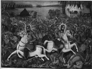
تابلوی نبرد عاشورا - موزه هنرهای زیبا کاخ موزه سعدآباد

اگر یکی از اهداف ایجاد موزه را ثبت و ضبط و معرفی نشانه‌های فرهنگی اقتصادی و فنی و اجتماعی بدانیم در این صورت باید به شیوه موزه‌ای به‌مثابه نماد انتقال دهنده پیام فرهنگی نگاه کنیم. یا این معنا که هر شیئی در موزه چیزی از مجموعه‌ای است که با کمک ابزار و روشهای صحیح تبلیغ و فرهنگی، پیام خاصی را به بازدیدکننده افشاء می‌کند. لذا اشیاء باید با شناسنامه مشخص و با توجیهی منطقی و قابل فهم برای کلیه افشار جامعه، در جای اصلی خود قرار گیرد. به نحوی که بازدیدکننده با مشاهده آنها خود را پیدا کند. در هر صورت موزه‌ها باید ضمن ارائه دقیق اطلاعات و نمایش اشیاء، با نصب تابلوهای مناسب، ارائه عکس، اسلاید، فیلم ویدئو کاستهای آموزشی از اشیاء مرمت شده شیئی، تکثیر مولاژها و ماکتها و همچنین برگزاری سمینارهای علمی و فرهنگی و... همگام با نیازهای آموزشی کشور حرکت