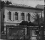
نمای صومعه موزه شامرو

ترتیب جاذبه‌های لازم برای بازدید از موزه‌ها را فراهم کرد تا ضمن سرگرم کردن مردم، حس کنجکاوی را در آنان برانگیزد و نکات آموزشی را به‌طور مستقیم به‌مردم القاء کرد. از جمله این کارها ایجاد پارک موزه است.