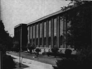
موزه ملی ایران - تهران

موزه‌ها پایگاه فرهنگ جامعه یا به‌زبان دیگر محل عرضه اصالت‌ها و نشانه‌های فرهنگی است، بنابراین باید از اعتبار و حرمت ویژه‌ای برخوردار باشند. مسئولیت اداره موزه‌ها را باید کارشناسان خیره فرهنگی عهده‌دار شوند تا بتوانند با هدایت صحیح اهداف موزه را به اهداف فرهنگی جامعه نزدیک و با آن همسوی گردانند. برای اجرایی‌ترین چنین هدفی می‌بایست هیئت انضامی متشکل از شخصیت‌های فرهنگی با اساسنامه مدون و دقیقی بر موزه‌ها نظارت کنند، چنین عملی برای اولین بار در موزه مردم‌شناسی واقع در میدان پازنده خرداد تجربه شد که امیدوارم این تجربه پسندیده در سایر موزه‌های کشور هم اعمال شود. ذکر این نکته لازم است که برای ایجاد و توسعه موزه‌های کشور با توجه به معیارهای زیر