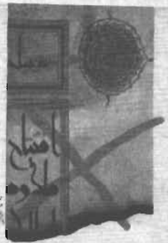
دیباچه نوین شاهنامه بهرام بیضایی

به تورشک می برم فردوسی مرد خویش گم کرده ای ام بی سرزمین با آن همه سرزمین که پدرانم به زور از پدران تو ستدند!