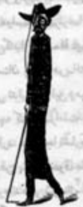
نوشته هارولد بی آلن Harold B. Allen ترجمه: حسین ابراهیمی (الوند)