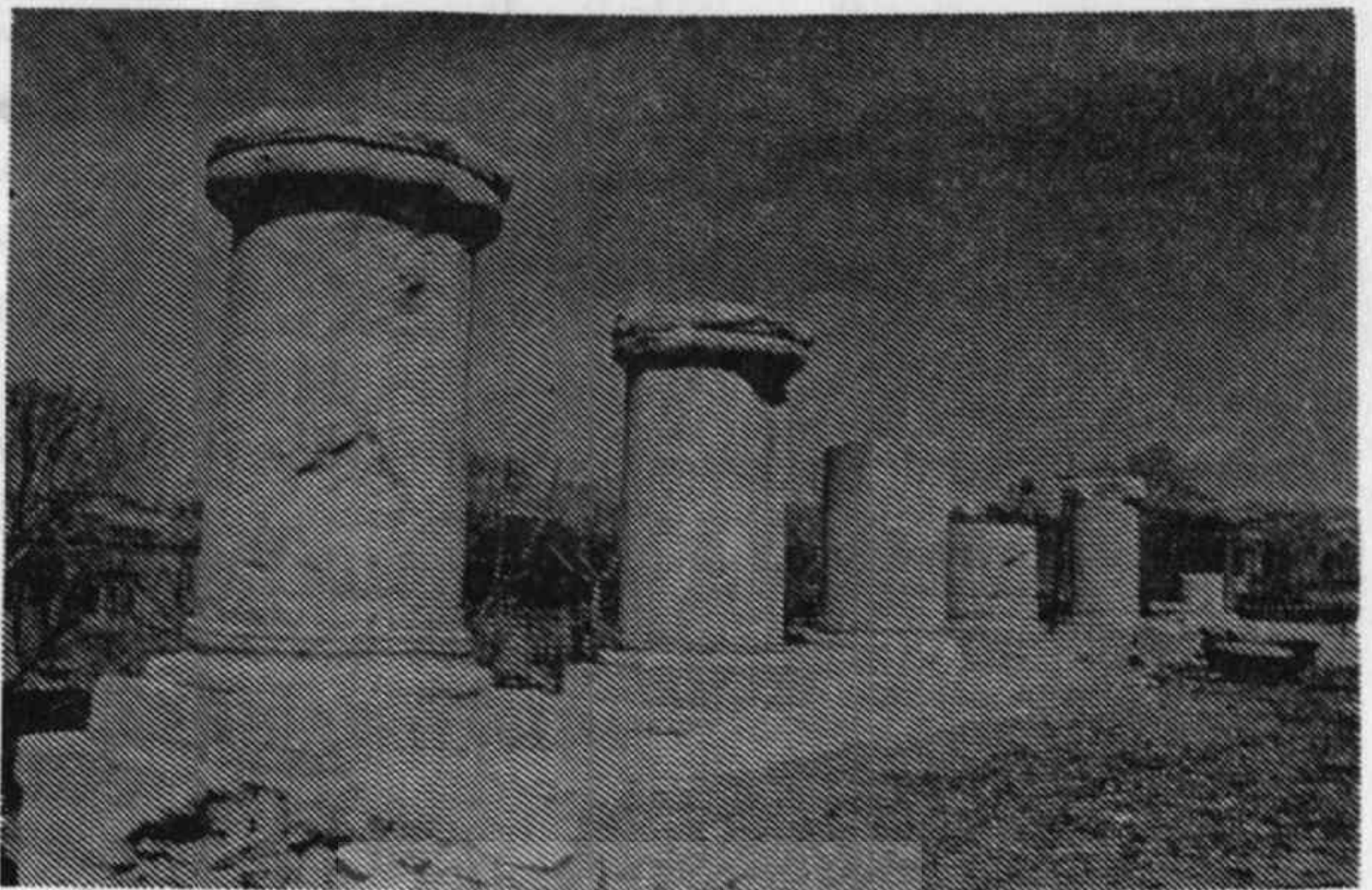
نمایی از ضلع شمال غربی پنا

شامل دیوارهای به قطر ۶ متر است که محدوده‌ای در حدود ۱۲۰۰ متر مربع را شامل می‌شود، که در جهت شرقی - غربی ساخته شده است و عملکرد آن هنوز برای ما مشخص نیست. از دیگر آثار قابل بحث این که، در پای دیوارهای شرقی بنای کنگاور تابوت‌ها و خمره‌های سفالی دفن اجساد مربوط به دوره‌ی اشکانیان به دست آمده که سکه‌های مربوط به این دوران از فرهاد اول (۱۸۱ - ۱۷۴ قبل از میلاد) و آرد (۵۶ - ۳۷ قبل از میلاد) درون این قبرها به دست آمده است. همچنین از دوره‌ی ساسانی و دوران مختلف اسلامی (اوایل اسلام، دوره‌ی سلجوقی، دوره‌ی ایلخانی، دوره‌ی صفویه و دوره‌ی قاجاریه) آثار مختلفی از لایه‌های باستانی این تپه به دست آمده است.