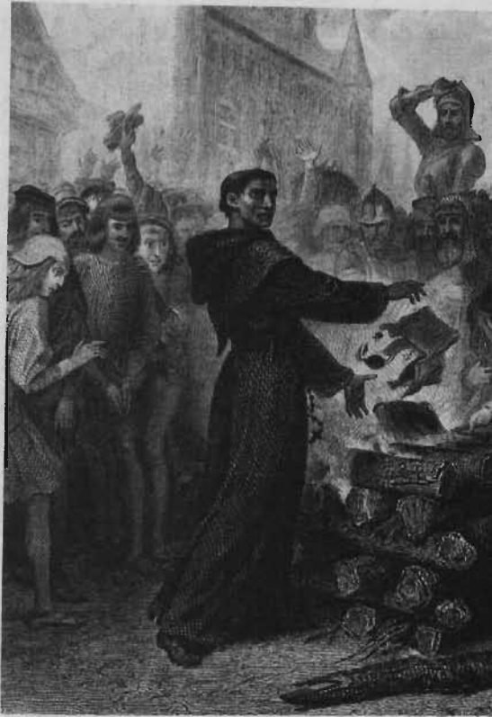
توماس مونتسر اصلاحگر آلمانی در منطقه کلتگاو (کنده کاری قرن نوزدهم).

ویتنبرگ، ۱۰ دسامبر ۱۵۲۰، مارتین لوتر اصلاحگر مذهبی آلمان، فرمان پاپ را که از او خواسته تا از عقایدش عدول کند می‌سوزاند (کنده کاری قرن نوزدهم فرانسه).