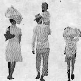
دانش‌آموزان، پس از تعطیل مدرسه‌ای نزدیک آدیس آبابا، اتیوپی، به سوی خانه می‌روند.

این همه به تقویت فرایند فردیت و به گسستگی وحدت سنتی خانواده می‌انجامد. با این همه، این امر به معنای آن نیست که خانواده سنتی افریقایی در حال تبدیل به خانواده هسته‌ای کوچک به سبک غربی است، بلکه به این معناست که باعث ایجاد خانواده‌هایی تک‌والدی می‌شود که پیرامون پدر یا مادر بنا شده‌اند. حرکت به سوی فردیت با نیاز انسان به تعلق به بخشی از شبکه همبستگی که غالباً دودمان را تداوم می‌بخشد در تضاد است. یعنی افراد به انجمنهایی می‌پیوندند که بر سایه سن و موقعیت اجتماعی استوار شده‌اند، انجمنهایی که به اعضای خود کمک اجتماعی می‌رسانند و از آنان پشتیبانی معنوی می‌کنند. این نمونه‌های محدود تحول رادر بافت اجتماعی و خانوادگی نشان می‌دهد. چنین مقاومتی در برابر تحول را ممکن است با تعبیرهایی در رد اکید ایدئولوژی فردی یا با محدود کردن قدرت دولت توجیه کرد. با این همه، محتمل به نظر می‌رسد که رویارویی میان ایدئولوژی غربی و ارزشهای اجتماعی سنتی به ایجاد ساختارهای جدیدی بینجامد که جامعه‌ای در حال تحول سریع آن را پدید آورده است.