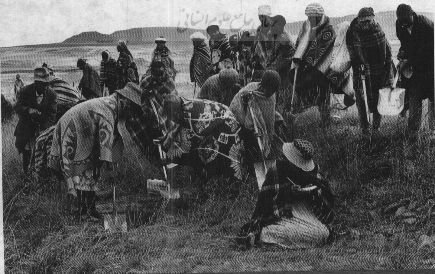
عملیات درختکاری در لسوتو توسط جمعیت محلی.

در کنیا، جنبش کمربند سبز که با انجمن ملی زنان حمایت می‌شود بیش از ۱۵۰۰۰ کشاورز و نیم میلیون دانش‌آموز را در تأسیس مجتمع ۶۷۰ قلمستان شرکت داده و بیش از دو میلیون درخت کاشته است. به سال ۱۹۸۵، درختکاری سالانه در چین به دو برابر