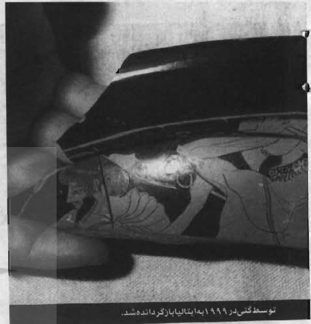
توسط گتی در ۱۹۹۹ به ایتالیا بازگردانده شد.

نظرسنجی‌های عمومی نشان از حمایت قاطعانه جهانی از میراث فرهنگی دارند، درحالی‌که کشورهای صاحب میراث غنی فرهنگی نظیر - ترکیه، ایتالیا، یونان و چین - مراحل بازیگری آثار فرهنگی شاخص خود را از آمریکا شروع