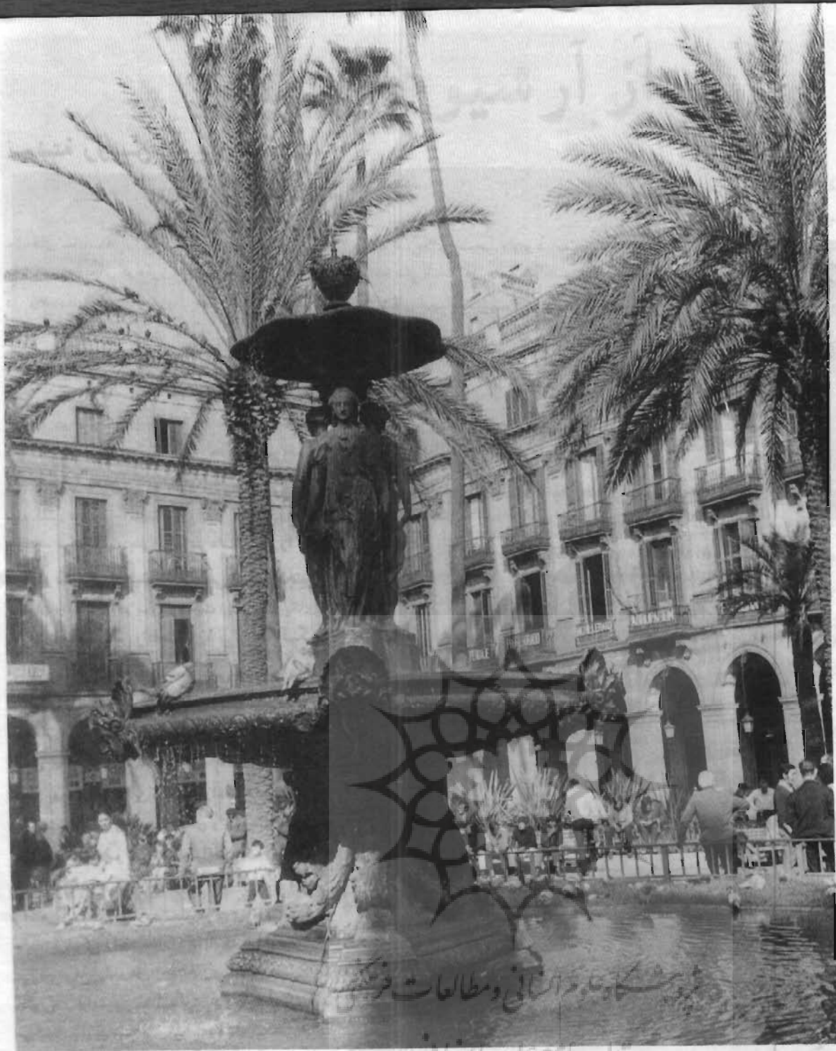
چشمه‌ای در پلازا رئال، بارسلون