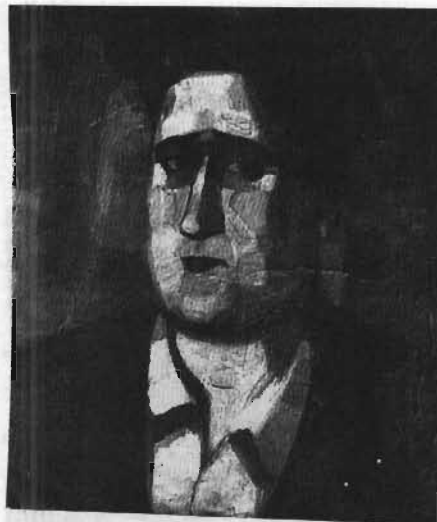
خط نگاشته ای از گیوم آپولینر (۱۹۱۸-۱۸۸۰) که اخیراً به کتابخانه ملی فرانسه اهدا شده است. تصویر فوق، پرتو آپولینر، توسط نقاش فرانسوی ژان متزینگر در ۱۹۱۴ چاپ شده است.

قانونهایی که در سال ۱۹۷۷ دولت فرانسه وضع کرد، از روشهای نگهداری حمایت می کند. یکی از کارهای کتابخانه ملی فرانسه فراهم کردن امکانات برای دستیابی به اطلاعات است، اما سیاست استفاده از نسخ خطی، که اگر زیاد دست به دست شوند صدمه