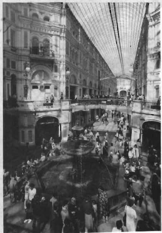
بازار سرپوشیده گوم در مسکو.

اقتصاد متکی به بازار تقریباً کمبود فراورده‌های مصرفی را که ویژگی اجتناب‌ناپذیر نظام برنامه‌ای توزیع است جبران کرده است. نبود مایحتاج اصلی که در ابتدای دهه ۱۹۹۰ در بالای سیاهه مشکلات و نگرانیهای بیشتر مردم جای داشت اینک در پایین سیاهه مشکلات حاد جامعه جای گرفته است و امروزه تنها درصد کمی از مردم به این کمبود اشاره می‌کنند (۷ درصد از میان ۲۴۰۰ نفر که در ماه مه ۱۹۹۶ از آنان