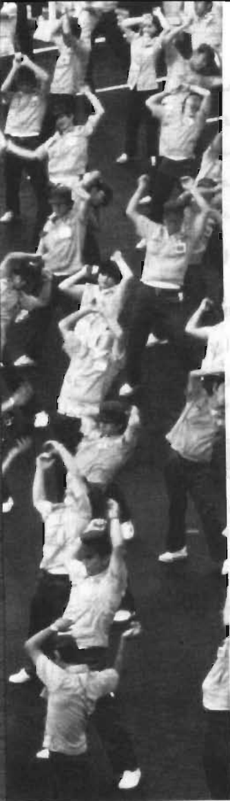
کارگران یک کارخانه سرامیک‌سازی در کاوشیما (جنوب غربی ژاپن) در جریان همایش هفتگی کارکنان حرکت‌های ورزشی را به نمایش گذاشته‌اند.