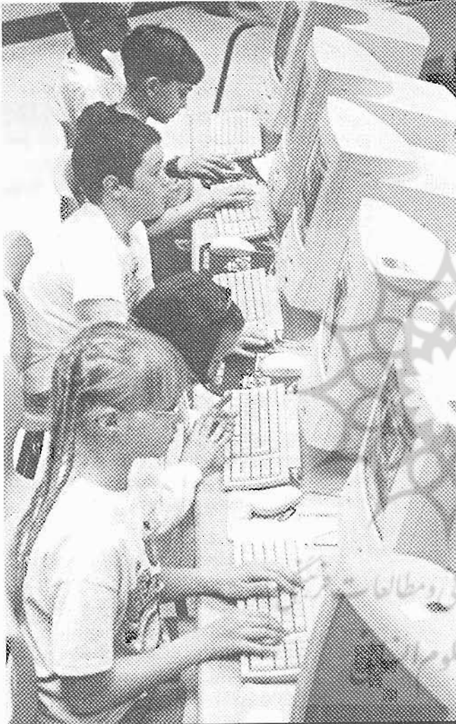
آماده کردن دانش آموزان برای نظام اقتصادی «دانش محور»

دبیر سرویس آموزشی روزنامه‌ی گلوب آند میل» (تورنتو، کانادا)