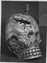
شرح عکس صفحه قبل

راستا: مجسمه‌ای پررنگه شده از بلور سنگ قرن ۱۵ تا ۱۶، عین چهره روی این مجسمه مقوایی نسبتاً طرد و آتانی است. صفحه مقابلی: شیرینی‌هایی به شکل خاصه و اسکن که اسب‌های روی پیشانی‌شان نوشته شده، از جنس شیرینی‌های مسورد. علاقه بسیاری از کودکان است.