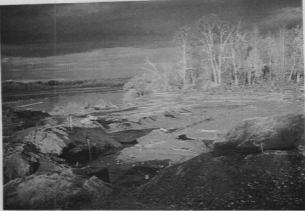
منظره حفريات (قسمت جلوي تصوير) يوشكي، يك مسحوطهٔ سپارينه سنگي در گامباجانگا. در اطراف تصوير، ابزار سنگي به دست آمده در آن مسحوطه نشان داده شده است.