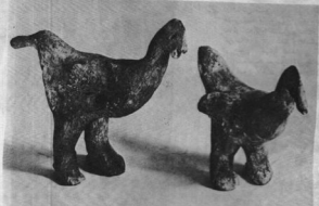
بدهای این دو مرغابی سفالین کوچک که به دوره سیلای قدیم علق دارد شبیه پای انسان ساخته شده است. زیرا پرندگان، هنگامی که کاش چلوگر با ارواح ارتباط برقرار می‌ساخت واسطه و میانجی اجباری وی را تشکیل می‌دادند.