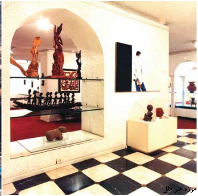
موزه هنر ملی

از سال ۱۳۷۳ تا ۱۳۸۲ در این مکان موزه پژوهشی مردم شناسی دایر بوده و در بهمن ۱۳۸۸ نیز با عنوان موزه تاریخ معاصر و هدایای سلطنتی خاندان پهلوی گشایش یافت.