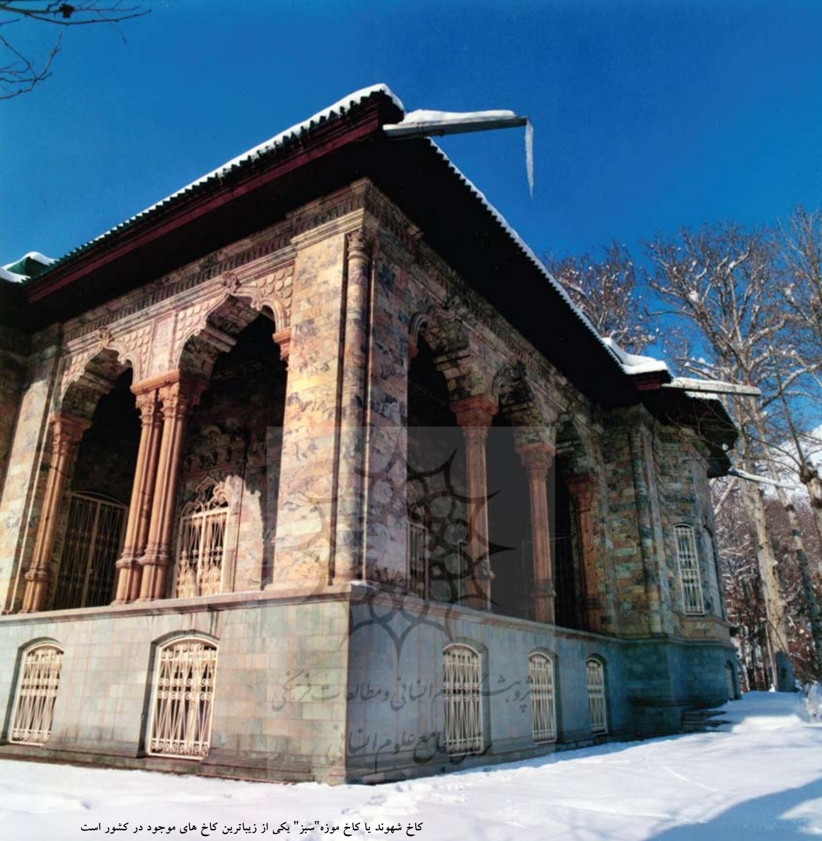
كاخ شهوند يا كاخ موزه "سبز" يكي از زيباترين كاخ هاي موجود در كشور است

است. اين كاخ از سال ۱۳۰۷ محل اقامت رضاخان بود. كاخ موزه سبز در نقطه اي مرتفع در شمال غربی مجموعه كاخ هاي سعءآباد قرار دارد. كاخ شهوند كه تكميل بنای آن از زمان وزرات جنگ رضاخان تا اوایل زمامداريش (۱۳۰۷-۱۳۰۱) به طول انجاميد پيش از آن ساختمانی بود متعلق به شخصی به نام "عليخان". نامبرده از زمين داران سرشناس آن زمان بود و تپه اي كه اين كاخ روی آن بنا شده به نام او به "تپه عليخان" معروف است.