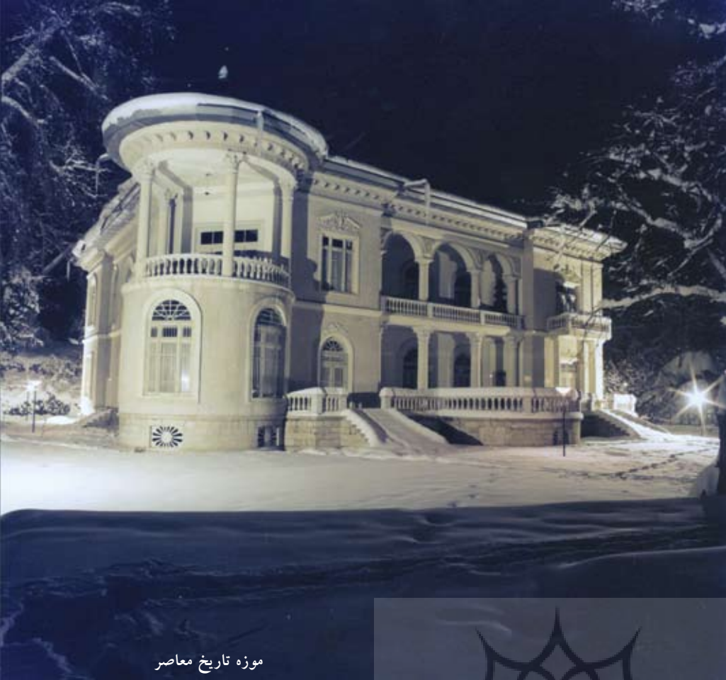
موزه تاریخ معاصر

آثاری از تمدن مایاها در موزه هنرملل وجود دارند که پیدایش آنها به اوایل سده اول پیش از میلاد نسبت داده شده است. پیش از کشف آمریکا، در سال ۱۴۹۲ میلادی دو کانون هنر و تمدن در آمریکا وجود داشته است، تمدن مایاها و اینکاها.