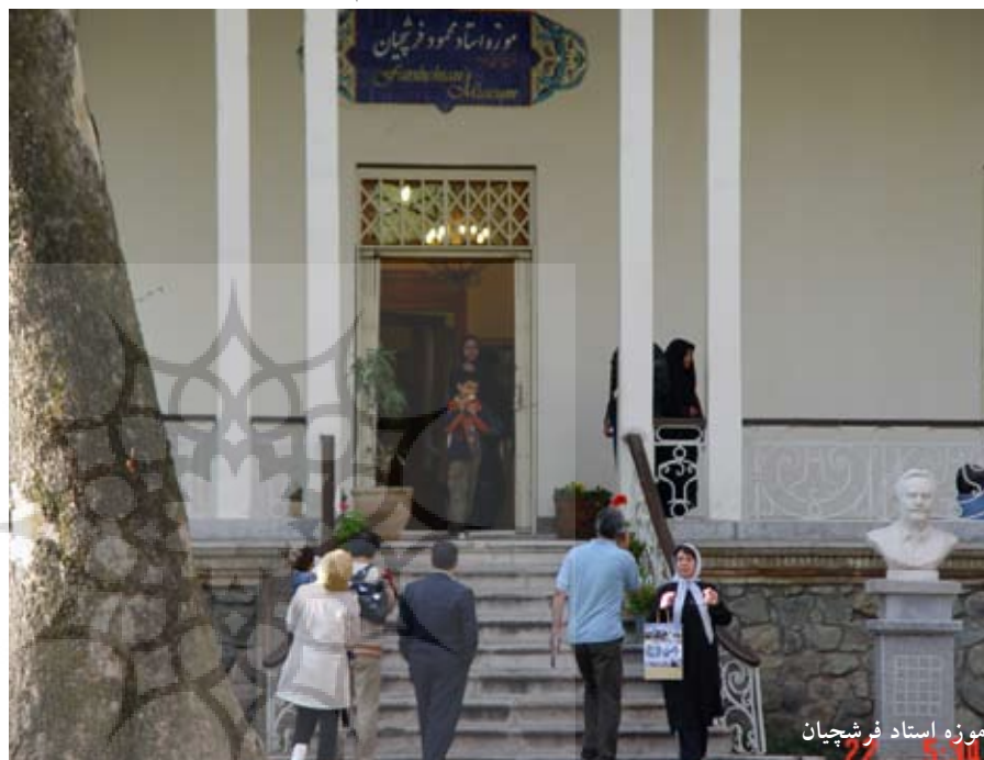
موزه استاد فرشچیان

و با قرار دادن موی گربه سفید در انتهای پر کبوتر قلم موهایی ساخت تا به امروز در نقاشی و ظریف کاری از آن استفاده می شود. اشتیاق به آموختن ایشان را ابتدا به اروپا و سپس به آمریکا کشانید و حفظ هویت ایرانی توانست شیوه کار خود را غنا بخشد. استاد در