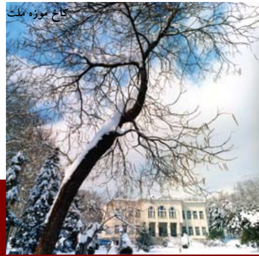
کاخ موزه ملت