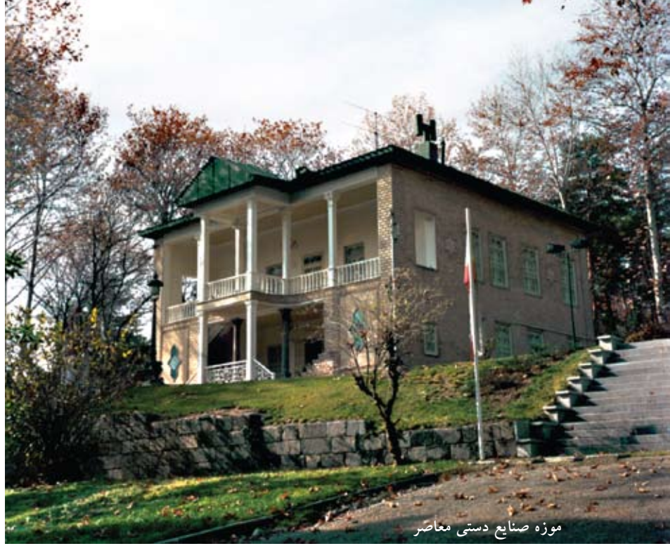
موزه صنایع دستی معاصر