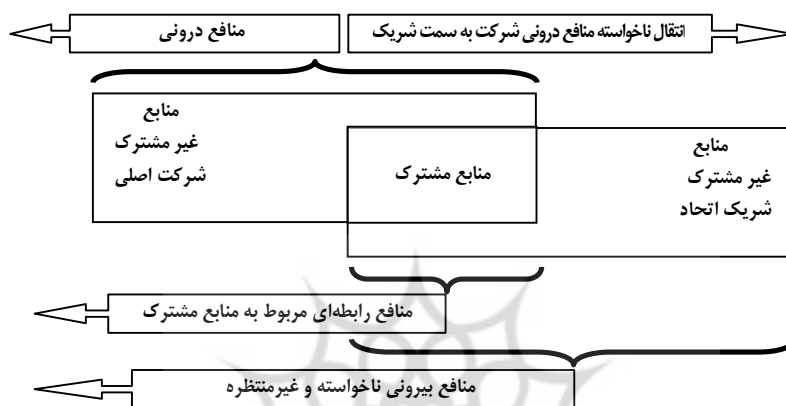
شکل ۱، ترکیب منافع ممکن برای یک شرکت در شرایط همکاری با شرکت دیگر [۱۹]

این دیدگاه، ماهیتی پویا به رویکرد مبتنی بر منابع داده است. زیرا برای اشتراک‌گذاری منابع بین دو شرکت و حتی منافع غیر مستقیم حاصل از منابع درونی دو شرکت بر یکدیگر نیز علاوه بر منابع غیرقابل تحرک یا غیرقابل معامله آنها، اهمیت قائل است. شکل ۱ انواع منافع حاصل از همکاری بین دو شرکت را در رویکرد رابطه‌ای نشان می‌دهد.