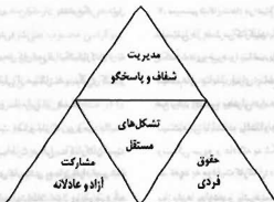
نمودار ۲. هرم دموکراسی در محیط کار

علاقی خاص خود. فضای شراکتی باعث اعتماد متقابل می‌شود و ابتکارها را افزایش می‌دهد و افراد نوعاً با کارایی و انگیزه بیشتر کار می‌کنند. فلسفه شراکتی به مفهوم آزادی بی‌قید و بند افراد نیست. آنها نباید از عظیم‌ها و مقررات مورد نیاز پیروی کنند. وقتی محیط شراکتی به وجود آمد، کارکنان به یکدیگر و به سازمان متعهد خواهند شد. یعنی اطلاعات محض از مقررات در محیط کار جای خود را به انجام کار خلاق و متعهدانه می‌دهد. برای ایجاد فلسفه شراکتی در محیط کار، لازم است مدیریت ارشد تعهد و حمایت خود را در عمل نشان دهد. برخی از مدیران مسکن است خود را یک طبقه مجزا، یا صاحب سازمان به حساب آورند. برای رسیدن به دموکراسی کاری نوین، مدیران باید متقاعد شوند که لازم است قدم‌هایی را در جهت برابری افراد بردارند. فرهنگ کاری برابری و برادری جدید باید مستند بر موارد زیر باشد: