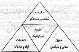
نمودار ۱. هرم دموکراسی سیاسی

دموکراسی محل کار تنها استراتژی پایدار است که باعث منافع سرمایه و نیروی کار می‌شود. دموکراسی در محیط‌های کاری به سازمان‌دهی ایده‌های اکثریت و تصویب آنها نظر دارد و بر تفویض اختیار، و نه نمایندگی، متکی است. یعنی افرادی برای اجرای کار انتخاب می‌شوند و حق تغییر تصمیم‌هایی را که موکلان اتخاذ کرده‌اند، ندارند. مجمع کارکنان تصمیم‌های کاری را اتخاذ، مدیران را انتخاب، و چگونگی انجام کار را سازماندهی می‌کند. معمولاً سازمان‌های منطقی‌های را فدراسیونی از نمایندگان کارکنان اداره می‌کند. در سازمان‌های کوچک، دموکراسی به‌طور مستقیم از طریق آرای افراد در تصمیم‌گیری‌های سازمانی تحقق می‌یابد و در سازمان‌های