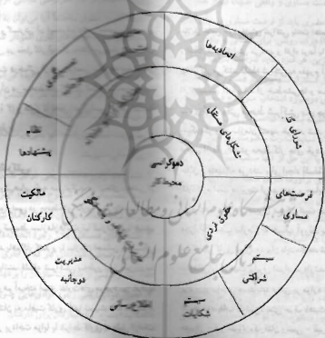
نمودار ۳. سازوکارهای تعریف شده برای دموکراسی در محیط‌های کاری

فرآیندهای مسئولیت‌های تعریف شده به‌منظور تعمیق آگاهی کارکنان می‌تواند به‌صورت‌های مختلف نظیر روش‌های الکترونیکی و