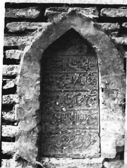
سنگ مزار شیخ معتمد امین خلوی

آن چنان که در سنگ قبر مذکور مشاهده می‌گردد امیر علاءالدین از سادات کدکن بوده و جد ایشان حضرت علاءالدین مستجاب الدعوه، از نوادگان امام سجاد (ع) بوده و در زمان غیبت صغری حضرت مهدی (عج)، زندگی می‌کرده است. اکنون مزار این بزرگوار، در قسمت جنوبی کدکن در محلی به نام (سرده) در بالای تپه‌ای قرار دارد. ۱