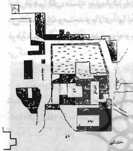
نقشه شماره (۱)

مجموعه معماری مذکور، در قسمت مرکزی شهر، در انتهای کوچه مزار بر روی تپه‌ای قرار دارد و بردور آن دیواری آجری کشیده شده، که آن را از منازل مسکونی جدا می‌کند.