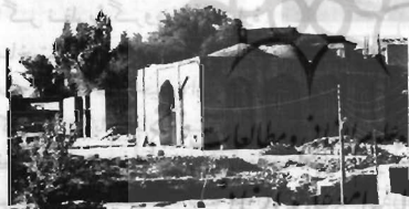
نمایی از مسجد

دلیل دیگر، چنان‌که در سطرهای بعدی خواهیم دید در دوره تیموری و صفوی سلسله خلوی کبروی در این محل به ارشاد و تزکیه نفس مشغول بوده‌اند و از طرفی دیگر چنان‌که ذکر شد، شیخ عطار خرقة از دست مجدالدین بغدادی پوشیده که او از مریدان نجم‌الدین کبری بوده است.