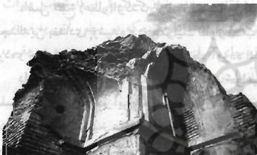
نمایی از مقبره

معماری قبل از دوره ایلخانی ذکر می‌کنند. ۲ و بعضی دیگر با توجه به سبک معماری و نقاشی و رنگ آمیزی مقبره و مسجد و ذکر تاریخ (۹۰۶ هـ ق) ساخت، آن را قدیمی تر از قرن نهم نمی‌دانند. ۳ اگر نظریه گروه اول درباره