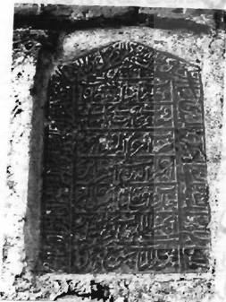
سنگ مزار امیر علاءالدین