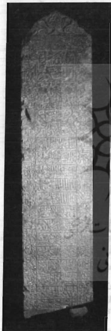
سنگ مزار خواجه نظام‌الملک

سنگ مزار دیگری از متوفای مذکور در اندازه ۵۰×۵۰ سانتی متر که قسمت پایین آن از بین رفته