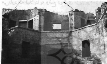
نمایی از ایوان

... در سنه ۱۲۵۲، اول ماه صفر و هر دو ربیع و بای عام، در خراسان افتاد... متصل به مسجد، در جهت جنوبی آن، ایوان بزرگی به عرض هفت و طول چهارده و بلندای دوازده متر قرار دارد که سقف آن توسط اهالی - در چند سال پیش - به کلی خراب شده است. سازمان فرهنگ و هنر (سابق) از خرابی بیشتر آن جلوگیری کرده است.