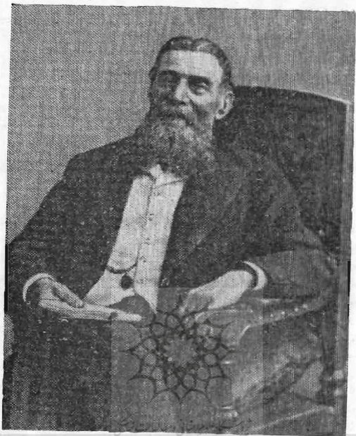
سوخوو - کابیلین

وجدان « محکوم کردند. زنج و عذاب‌هایی که نویسنده در سازمانها و اداره‌های مختلف از مأمورین قرطاس باز متحمل گردید و بسر بردن در زندان مطالب زیاد و گرانبهایی برای تریلرژئی معروف وی تأمین نمود. محققین شوروی بسا انکاء بهمدارک و دلائل مستندی گناهی کامل سوخوو - کابیلین را به اثبات رساندند. مأمورین قضائی به امید دریافت رشوه از خانواده ثروتمند سوخوو - کابیلین پرونده‌ای علیه او سرهم کردند. سوخوو - کابیلین نوشته بود که از او ۵۰ هزار روبل رشوه مطالبه میگردند.