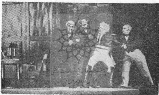
صحنه‌ای از نمایشنامه «پرونده»

سوخوو - کابیلین برای نمایشنامه «مرگ تارلکین» ۱۱ سال (بطور متناوب) کار کرد. نویسنده این نمایشنامه را بهترین اثر خود میدانست. نویسنده در سال ۱۸۹۲ هنگامیکه سعی میکرد این نمایشنامه را روی صحنه آورد چنین نوشته بود: «من طبق دستور اداره سانسور آن را تغییر دادم و تصحیح کردم و پایان جدیدی برای آن نوشتم ولی هیچ چیز سانسور را قانع نکرد.» ده سال بعد، در سال ۱۸۹۲ سوخوو - کابیلین مجدداً نوشته بود که «نمایشنامه را تغییر دادم تا آن قسمتهائی را که موجب خشم اداره سانسور گردیده حذف نمایم». او حتی عنوان نمایشنامه را نیز تغییر داد و آن را «روزهای خوش راسپلیوف» نامید. صحنه‌های شکنجه و خطابه اختتامیه آن را نیز حذف نمود. ولی با اینحال اداره سانسور نمایش آنرا ممنوع کرد. سوخوو - کابیلین با استفاده جسورانه از مبالغه و طنز و شیوه‌های کمدی ضربت اساسی را علیه پلیس که تکیه‌گاه دار و دسته کارمندان فامد و رشوه خوار بود متوجه نمود و جنبه‌های کمدی و طنز آمیز به نویسنده کمک کرد تا واقعیت زندگی را تجسم بخشد. واقعیتی که بصورت حاد و مضحکی مجسم شده نیروی بیشتری کسب میکند. نویسنده