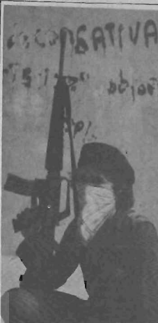
سیاسی - اقتصادی

رسیده است. مطرح کرد و اگهی های تبلیغاتی در روزنامه ها چاپ رسد که در آن فدراسیون دهقانان مسیحی به کشتی های سوختی، کشتی های دیگر و حتی اسلحه اعظمی، توریس چابری گرانس، محکوم کرده بودند. دولت نیز طرف پیروز بود. در اوقات شکست و اخراج کشتی ها در اوقات تا اواسط سال ۱۹۷۷ با بیش از ۲۰ کشتی چنین معاهده شد. افکار حمله به کلیسا و سازمان های مردم مدافع بود با آخرین حمله مبارزات انتخاباتی که در آن اشغال اصلاح طلبانند. اخیراً از پیروان ملی و در مقابل حزب حاکم طرف گرفته بودند. پس از آن که حزب حاکم از طریق تلفنگ گسترده اشعارات را برد، و اتحادیه از پیروان ملی، نظارتان یک هفته ای را تسهیل داد که نمایان باشد. بافت که در حال بود. در آن دوره حمله قرار داد و با ضرب و شتم صدها تن، ۲۰ یا بیشتر را کشتند. خونی که بر کف خیابان ریخته شده بود پاشان های اینهاقی کشید.