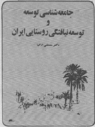
نمایشگاه بهره برداری منطقه ای مورد عمل قرار می دهد.

مرکز خدمات روستایی، روستایی و مشاوره ای بخش واحد برنامه زراعی، بهداشتی، مشاوره ای و نظارتی یک کشاورزی در سطح دهستان است که با اصلاح سیستمها و برنامه های کشاورزی با همکاری و مشارکت مردم بر اساس شناخت عوامل تولید، موجهات بهبود و توسعه کشاورزی حفظ و بهبود منابع طبیعی به صورت جامع از افرون