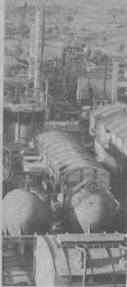
این روند ادامه پیدا کرد تا آنکه سطح قیمتها به ششگانه ۶ تا ۷ دلار کاهش پیدا کرد و موجب بگرسی اساسی کنسروهای فروخته و حتی بارهای از کنسروهای مصرف کننده شد.

کنسروها در نظر گرفته شده بود. - ریجند (نمایی در مراکز مصرف توسط مالکین و حسابرسان کنسرتها از سوی کنسروهای خلیج فارس و اعضاء سیاستهای خاص و طرح شعارهایی در درون اوپک که برانند بازار را از یک حالت ثابت خارج کند و آزادی عمل برای کلیه کشورهای در حوزان تولید بوجه آورده تا تعیین و امتیاز برای خریدار از نظر روشی، سیاسی، کالایی و نقلی در بازار ایجاد کند. همچنین سیاست کسب سهم عادلانه از بازار و در واقع رقابت ایجاد کردن میان اوپک و غیر اوپک برای کسب سهم بیشتری در بازار از جمله سیاستهای بود که از سوی عربستان مطرح شد.