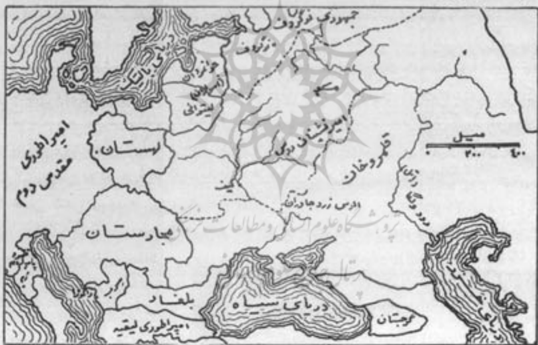
نقشه اروپای شرقی در دوره مغولان

پس از مرگ کیوک سه سال مدت گرفت تا جانشینش به تخت برآمد. درین دوره کوتاه بیخانی کارها از سامان افتاد. هنگامی نظم و نسق برقرار گشت که منکو، خان شد. وی از شعبه دوم خاندان چنگیز بود. منکو که [مانند کیوک] سابقاً در خدمت باتوسرمی کرد برآمدن خویش را بر چهاربالش قاآنی مدیون معاضدتهای باتومی دانست. منکو در جنگهایی که به ضد ترکان قبیچاق یا قومانها، و به قول روسان پلوتسی که در جنگلهای نزدیک مصب ولگا روی داد و از نمایشنامه بورودی این ۱ به نام «شاهزاده ایگور» از آن باخبریم شرکت کرد و به دلاوری سرفرازید. سپاه زیر فرمان او بر کیف غلبه یافت. در دوره خانیه تمام امپراطوری، دوستانه، میان این دو سرور توانا و کارآمد بخش شد. منکو به ویلیم روبروک، فرستاده لوئی نهم [پادشاه فرانسه از ۱۲۲۶-۱۲۷۰ م.]، چنین گفت «همچنان که نور آفتاب به همه جا تابان است حکم من و باتو به همه عالم روان است. «هجوم مغول به اروپای غربی، از نو، ممکن می نمود.