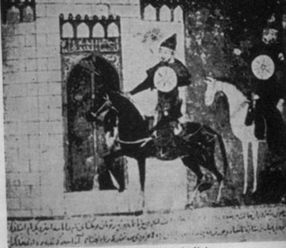
مغولان شهری را محاصره کرده‌اند

در ماه دسامبر مغولان از دانوب یخ بسته گذشتند و به کرواسی رسیدند و شهر زاکراب را تصرف کردند. بیلابی چهارم پادشاه هنگری [۱۲۳۵-۱۲۷۰] به ساحل