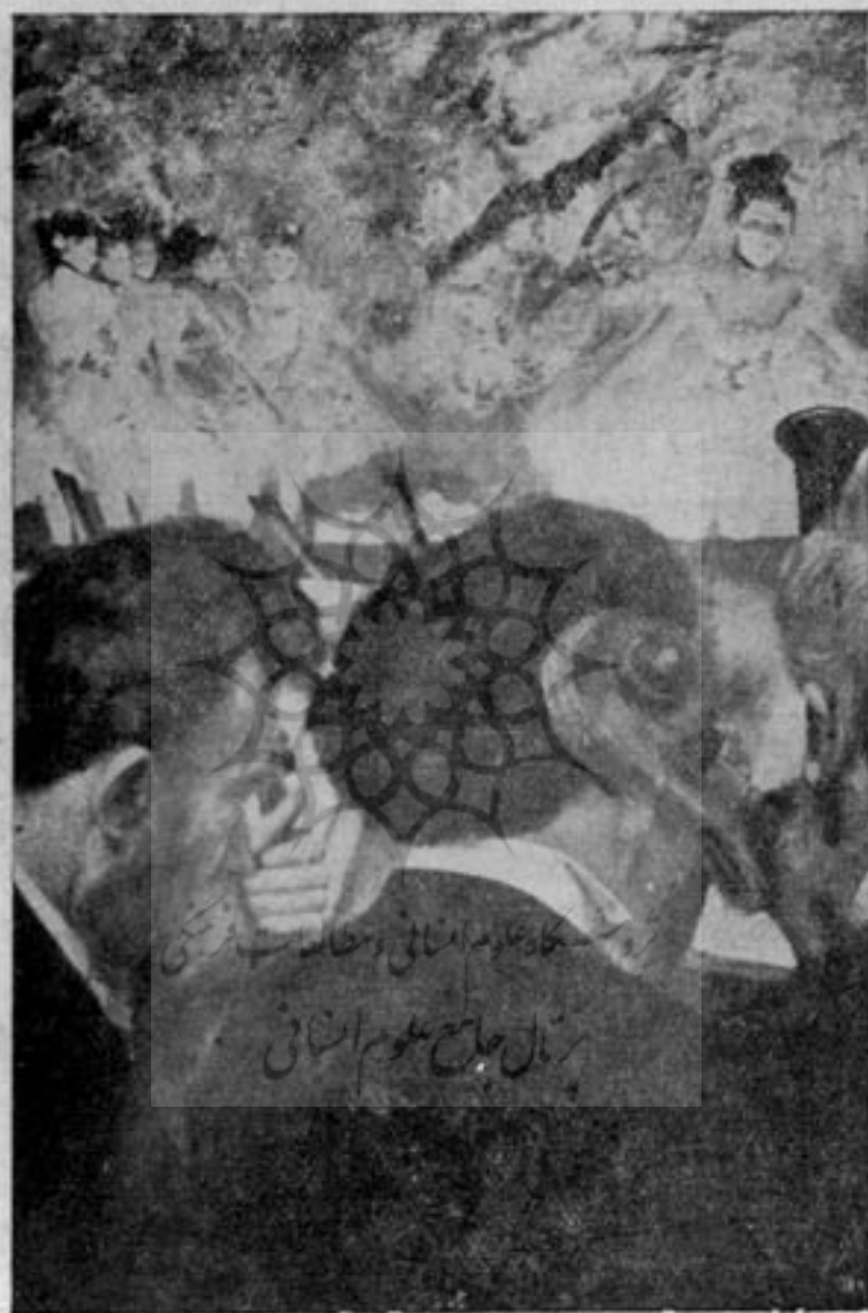
نوازندگان ارکستر اردگان

و متتبعین بنماید. مثلا بتصویر شماره ۱، عنكبوت، بنگرید. عکاس هنرمند معروف، آندره آس فاینینگر (۱)، بدون هیچ ادعای علمی، بطبیعی ترین نحوی در مدت یکصدم ثانیه کاری را که برای یک نقاش ماهر مستلزم ساعت ها بلکه