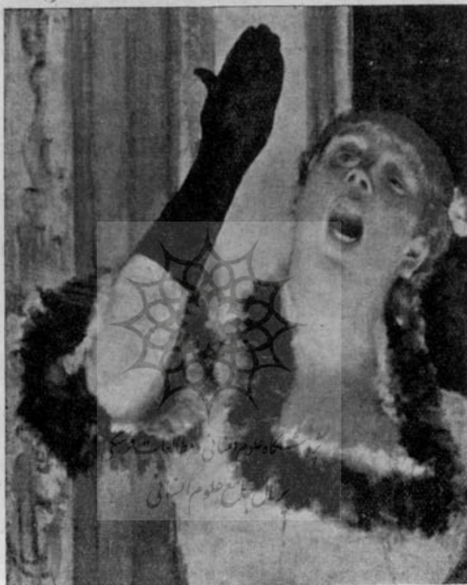
خواننده کافه کنسرت اثر دگما

از لحاظ تاریخی، عکاسی اتفاقاً در عهدی اختراع گردید و رایج شد که فرانسویان از زمانیتسم خسته و زده گشته کم کم بمکتب رئالیست مایل می شدند.