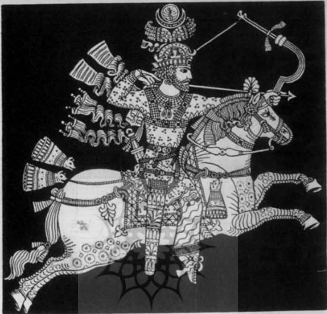
پوشاک‌های شاهان ساسانی و مطالعات فریبگی تصویر ۳۳

که مانند « تبار » کلاه خاص شاهان آل هخامنشی است و زلفان پریشت و مجمدش بیرون آمده و با پارچه کارس پوشیده شده است. از لبه نواج نواری به پشت رفته و گره خورده است و انتهای عریض و پرچین و شکن آن در حال اهتزاز است. البته در نشان دادن جمعد زلف زیاده روی شده، این زیاده روی در چین و شکن های نواری که به جای بند کفش به کار می رفته است نیز به چشم می خورد.