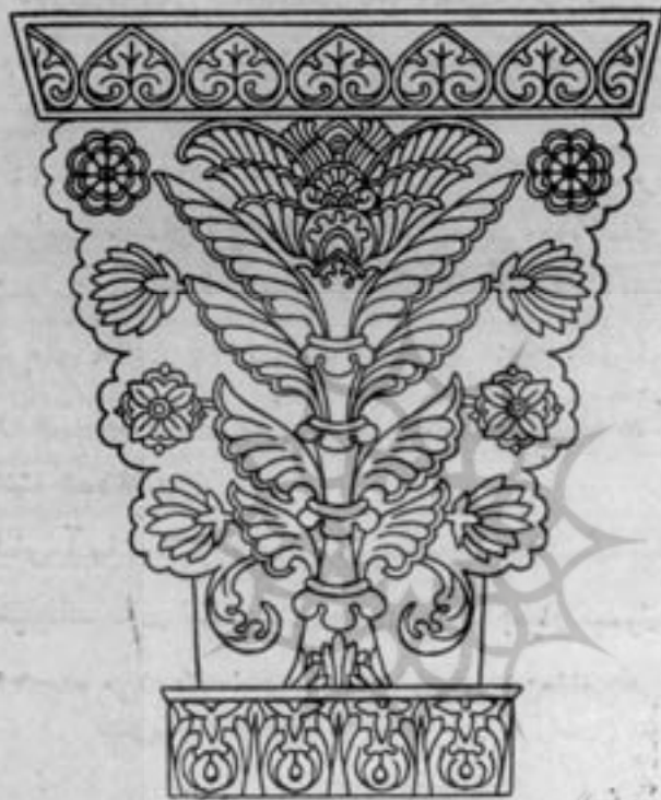
زینت و زیور لباس در زمان ساسانی

طرح زلی که در تصویر ۲۸ می بینیم از بشقاب نفرمای کار زمان ساسانی که در موزه ملی روس موجود است نمونه برداری شده است. کیسوی بلند این زن و نواج سرش که از برگ درخت غار درست شده جالب توجه است ولی لباسش تفاوتی با جامه دو زن دیگر ندارد. بطور کلی می توان گفت که جامه زنان در دوره ساسانی فرق چندانی با لباس پیشینیان آنها و آشوریان نکرده و فقط شیوه خاص هنر این دوره ظاهر جامه ها را به صورت دیگری آراسته است.