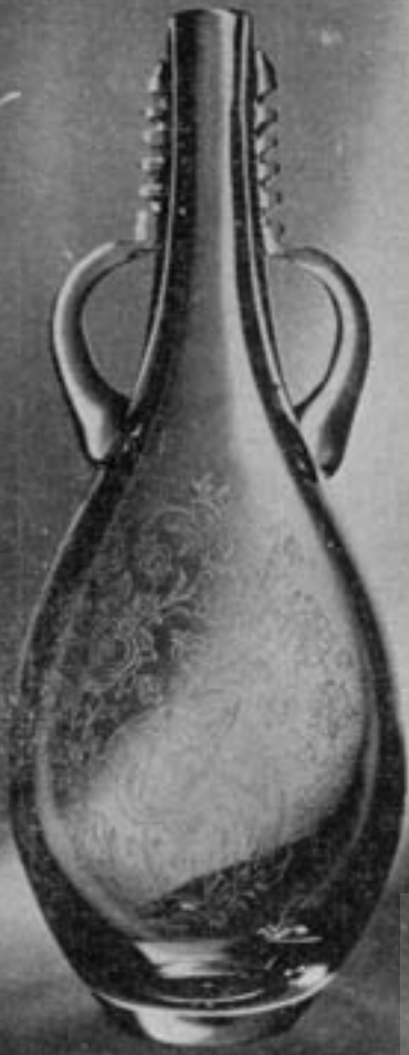
۹ ایران حسین ختایی