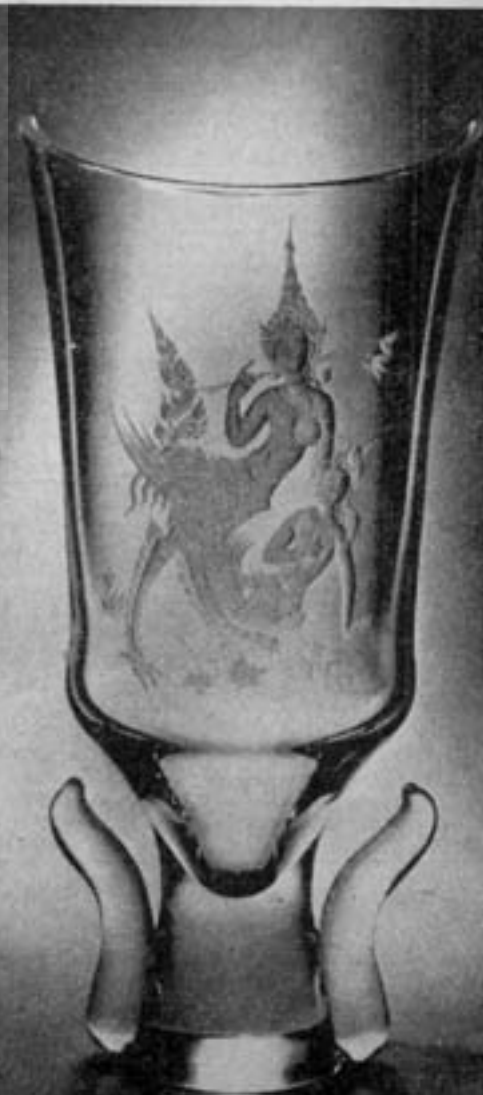
۴ تایلند ویروژنا نوتا پوندو

پروفسور رستم جامع علوم انسانی و مطالعات فرهنگی