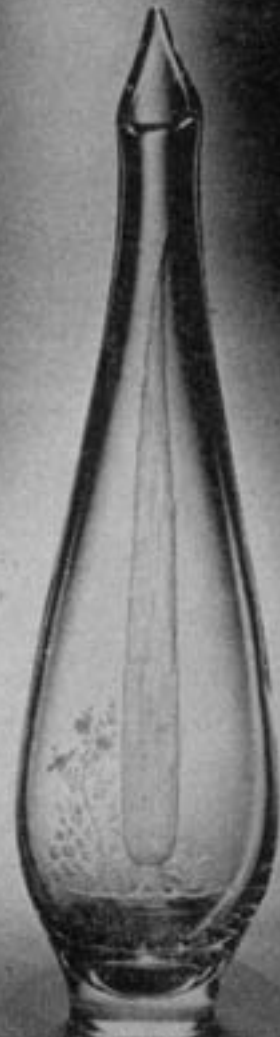
۱۰ ایران جعفر شجاع

پژوهشگاه علوم انسانی و مطالعات فرهنگی رسال جامع علوم انسانی