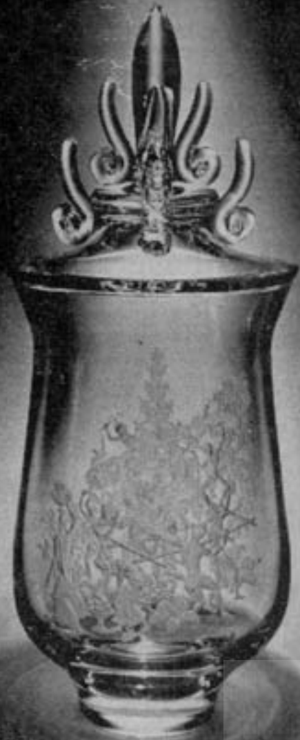
۳ اندونزی میدجیت

پروفسور رستم جامع علوم انسانی و مطالعات فرهنگی