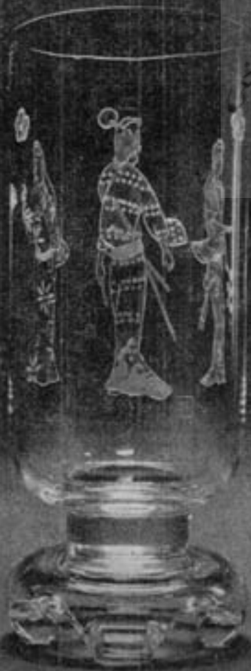
۲ ژاپن سونه کیشی آکاها

پرویشگاه علوم انسانی و مطالعات فرهنگی پرتال جامع علوم انسانی