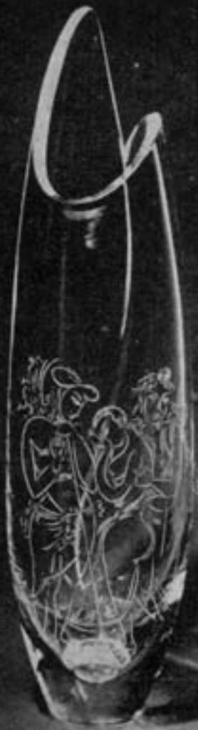
۸ سرندیب جرج کیت

پروپوشگاه علوم انسانی و مطالعات فرهنگی پرتال جامع علوم انسانی