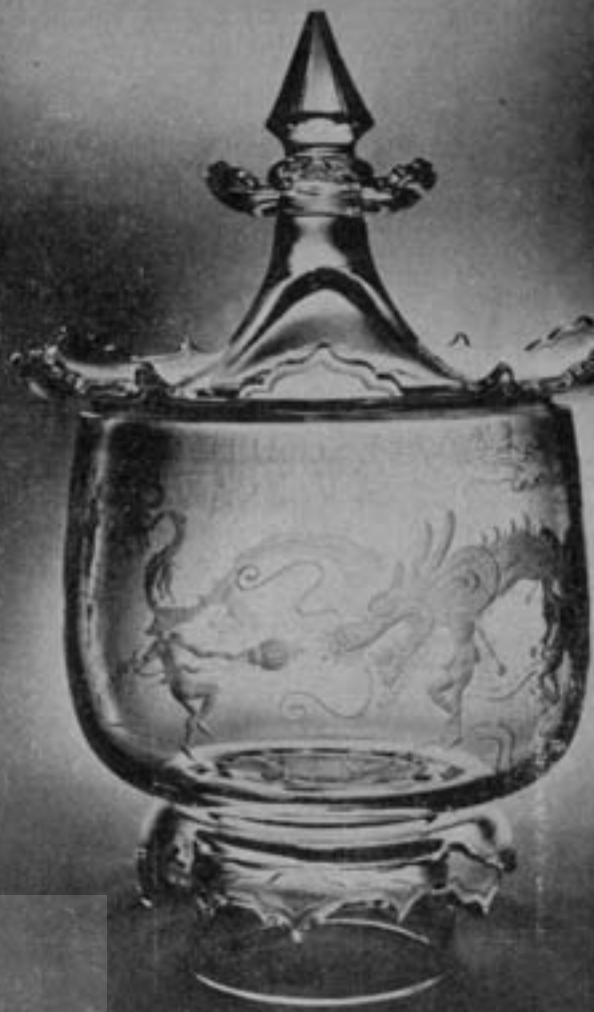
۱ چین دن این تینگ