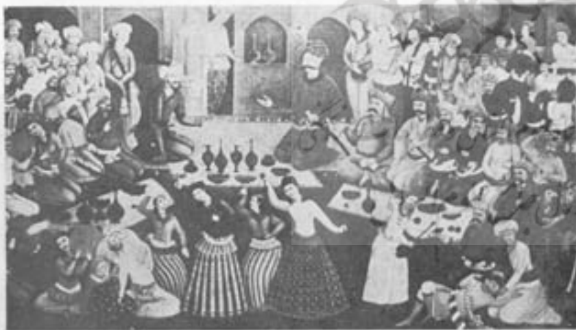
جلس پفرایش شاه عباس اول از رئیس لاریکان

اقدامات لازمی که در نگاهداری آثار تاریخی کشور و بالاحسن شهر اسفهان بعمل آمده است کاخ چهلستون را نیز روح تازه بخشید . موقع مناسب و ایهت و زیبایی کاخ وزارت فرهنگ را با ایجاد موزه معتبری در این بنای باشکوه مصمم ساخت خوشبختانه موجبات آت بزودی فراهم آمد و کاخ چهلستون قریباً موزه شهر اسفهان و از زیبا ترین موزه های کشور میگردد .