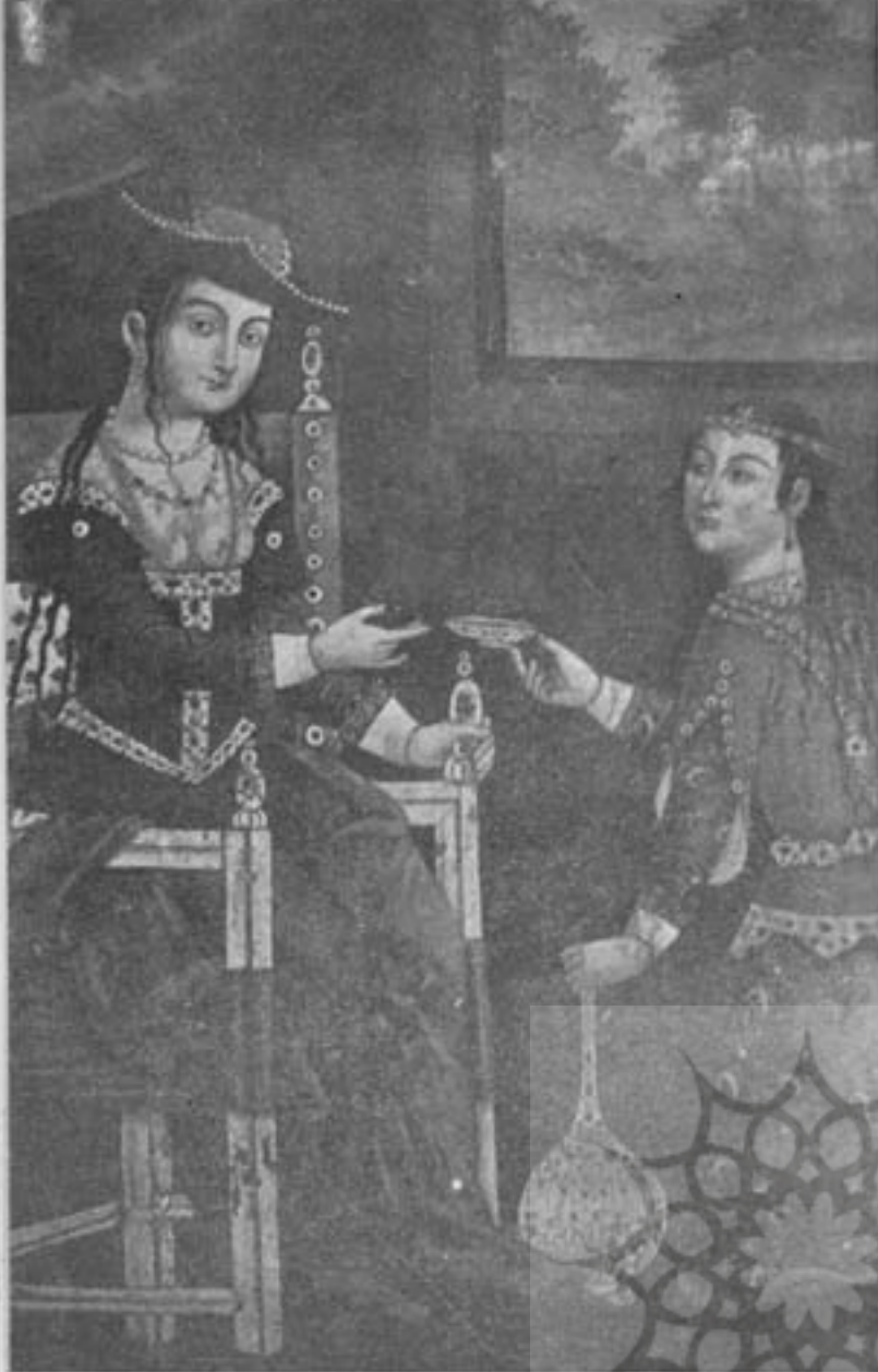
یکی از مینیاتورهای قشنگ

شده مایهٔ افتخار نالار پذیرائی پادشاهان با عظمت سفوی نیست و از دو بیت شعر پائین مبدعات ببرد کرنال برمیآید که این برده نقاشی در زمان اولین پادشاه قاجار به ساخته شده بعلاوه سبک نقاشی و رنگ آمیزی این دو قسمت هم قابل مقایسه با چهار بردهٔ زیبای گوشه های نالار است. چهار بخاری دیواری زیبا در نالار پذیرائی وجود دارد و در همین نالار بوده است که یک تخت باشکوه از سنگ بشم بر روی بدن شیرها که پادشاه هنگام پذیرائی سفیران بر آن مینشسته قرار داشته تخت منظور در آشوب و هرج و مرجی که بعد از این ایام در کشور ایجاد شده از میان رفته است. غیر از اینها در چهار گوشهٔ این نالار قشنگ چهار اطاق با نقاشی های خوب برای اقامت افسران کار پادشاهی جمع شدن وزیران و بزرگان دربار موجود است.