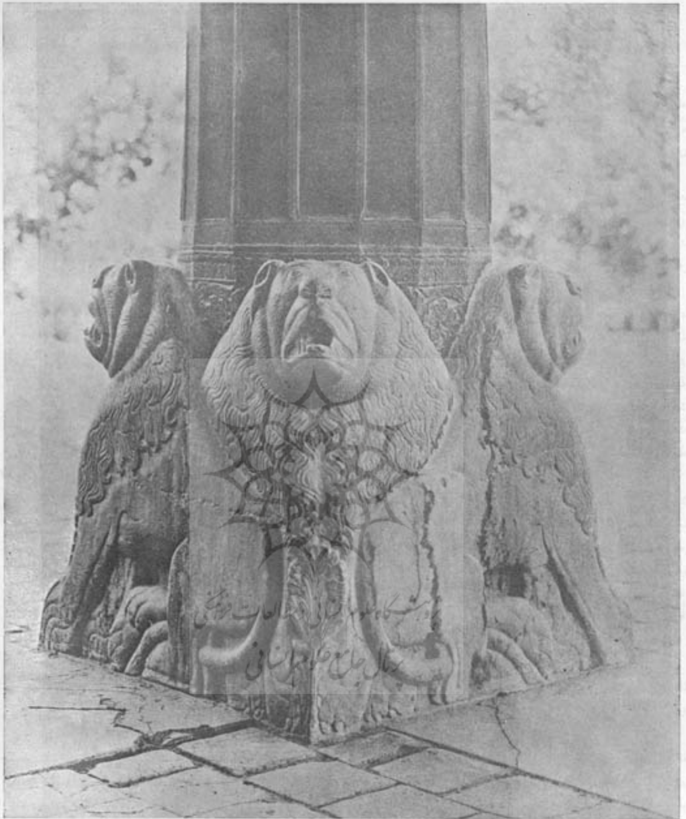
یکی از زیر ستونهای ایوان چوک که بر روی پهن شیرها قرار دارد