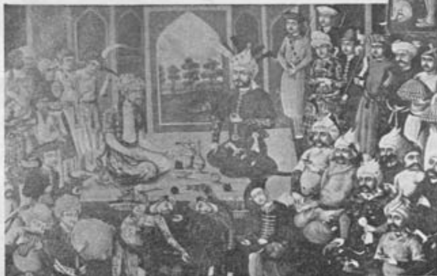
مجلس پذیرائی شاه طهماسب اول از رئیس ازبکان

شاه هندی. ۴- مجلس بزم شاه عباس دوم با رئیس ازبکان. ۵- ببرد نادر شاه با ارتش هندوستان (کرنال). ۶- ببرد شاه عباس بزرگ ازبکان با ارتش عثمانی (کرنال). از این شش قطعه نقاشی چهار قطعه آن بلا تردید از دورهٔ سفویه است ولی نقاشیهای ببرد چالدران شاه اسمعیل و ببرد کرنال نادر شاه از الحاقات بعد از دورهٔ سفویه و افشاریه است زیرا ببرد چالدران که بشکست شاه اسمعیل و سفویه تمام