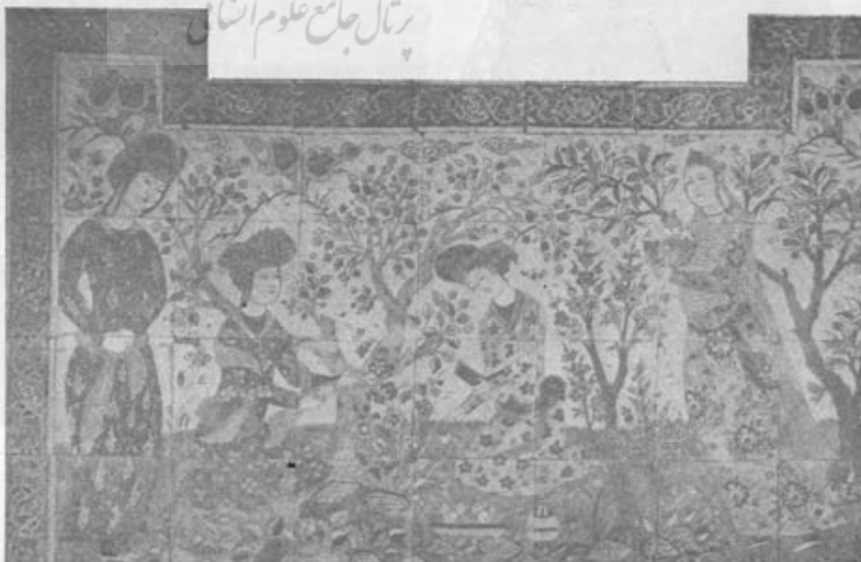
گوربت کاشی درینچه دیوار کاخ جهل ستون