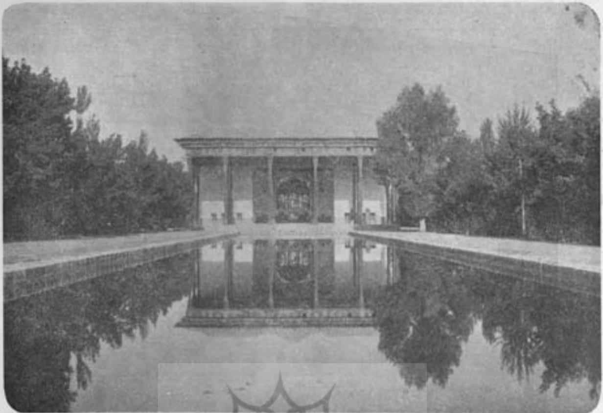
دورنمای چهل ستون از کنار استخر