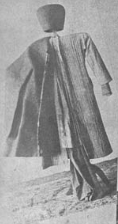
لباس شبان کر