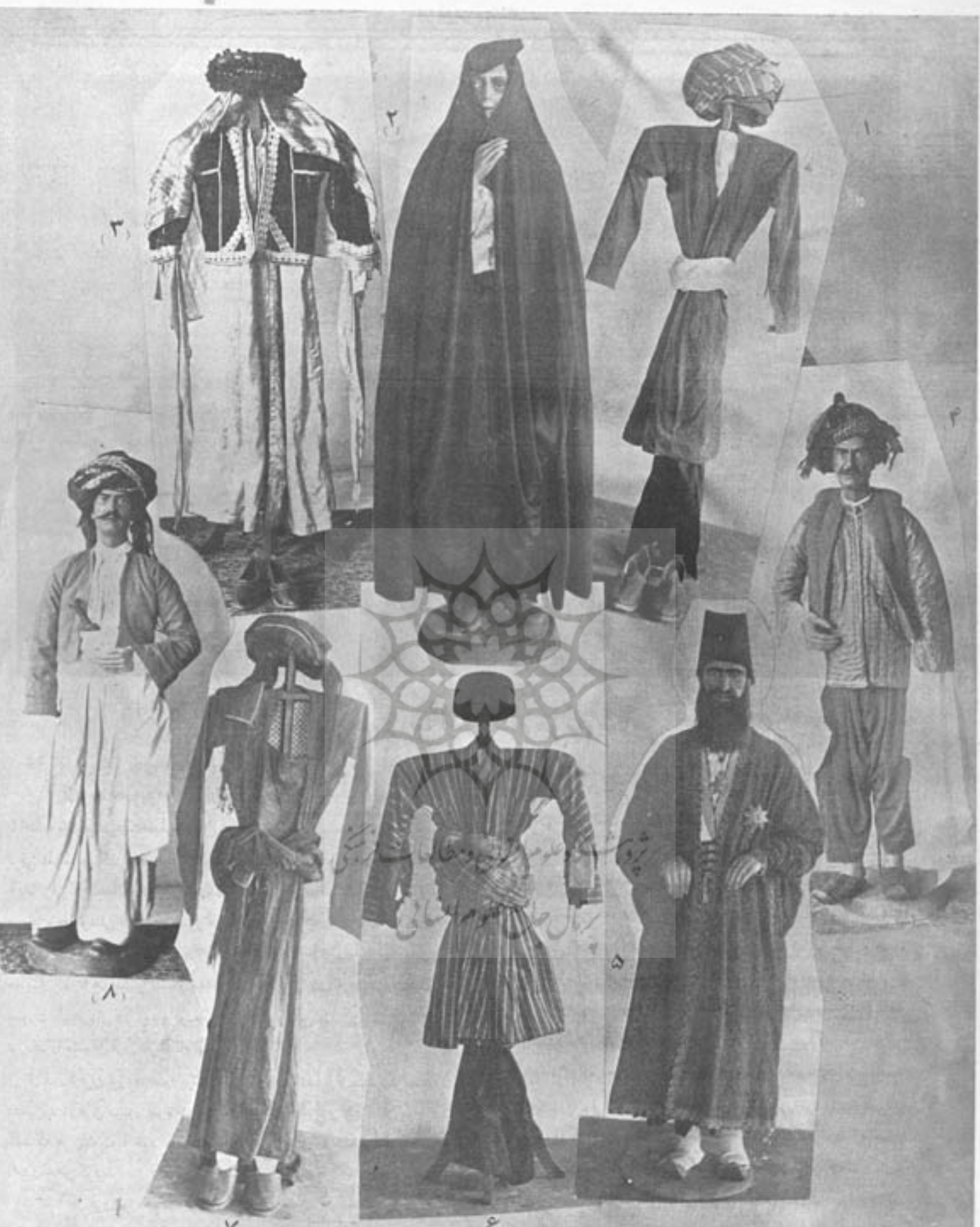
۱. لباس آردن تبریز ۲. لباس زلفی زرد و آتشکده ۳. لباس زنانه کلهر ۴. لباس آندکزد و آندکزد ۵. لباس شستنی ۶. لباس مردانه کلهر ۷. لباس مردانه آردن ۸. لباس مردانه کلهر