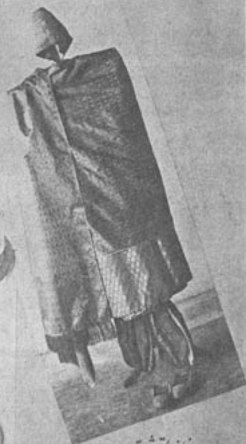
لباس فاخر رشتی