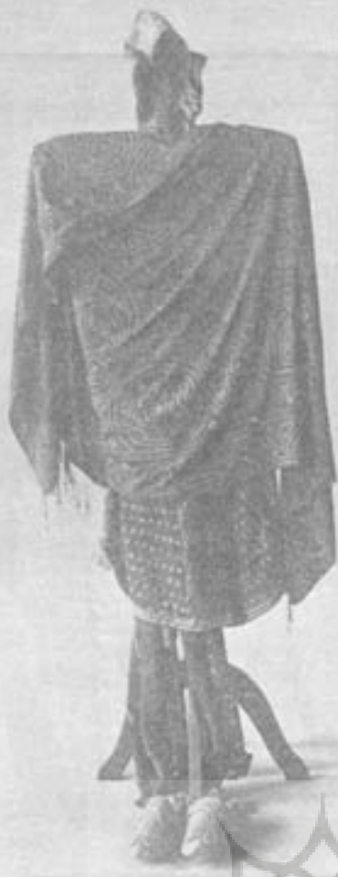
لباس زنانه رشتی