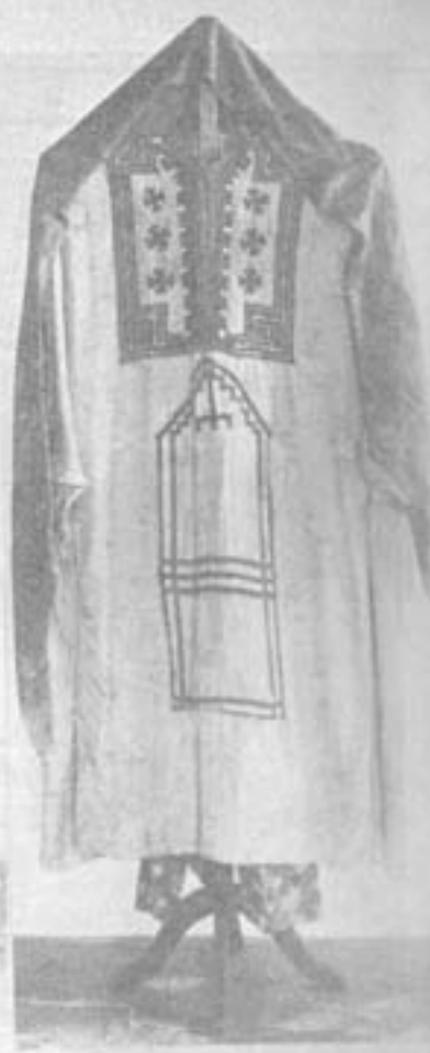
لباس زنانه بلوچ

واقع شده و ژادهای مختلف در آنها زندگی میکنند سعی میشود که در جزئیات اخلاق و عادات و اسباب آرایش آن اقوام تحقیقات و بررسیهای عمیقی شده نمونه های برجسته بطوریکه مشغور فوق را تأمین کند جهت موزه تربیت دهند در کشور ایران نیز در سال ۱۳۱۶ برای حفظ روش زندگی بیاکن و آثار آنها اقدام بنائیس موزه مردم شناسی شده و در این مدت کم پیشرفت زیادی حاصل گردیده است یکی از وظایف مهمی که برعهده این موزه است وظیفه ملی است زیرا که هیچ ملتی نمیتواند با امتیاز و مفاخر و اهمیت گذشته خویش واقف باشد جز اینکه بروش بیاکن خود آشنا بوده و از آن اطلاع کامل داشته و از روی کمال دقت و کنجگویی با داب و سیر آنها معرفت حاصل نموده باشد . خلاصه آنکه باید بررسی عمیق در نظامات و قوانین و چگونگی آنها نموده و اختلاف آنها را بیاکن دیگر سنجیده و در نتیجه از بهر مآئبکه ممکن است از این بررسی ها برده شود استفاده نماید . دیگر وظیفه علمی است که روش زندگی فکری و جسمی ایرانیان را از آغاز حیات مورد تحقیق و کنجگویی قرار میدهد زیرا کشور ایران در اثر وضعیت جغرافیایی که دارد از دیرباز ژاد های مختلف در آن زندگی نموده و با یکدیگر مخلوط شده اند که تحقیق در این قسمت یکی از مباحث مشکل و مهم مردم شناسی است چنانکه برخی از دانشمندان و علمای بیگانه تحقیقات زیادی نموده و کسب هم در باب ژاد شناسی ایران نوشته اند که آن تحقیقات باید ادامه یافته تکمیل شود زیرا که شناسایی به ژاد بشر خصوصاً مردمی که در این سرزمین زندگی میکنند قسمت مهم علم مردم شناسی را تشکیل میدهد . واضح است که تأسیس موزه مردم شناسی در ایران یکی از اقدامات