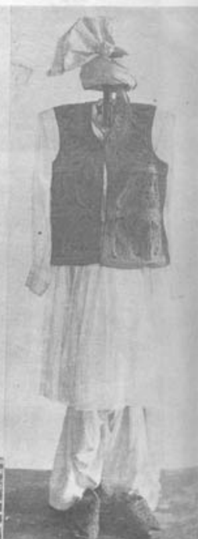
لباس مردانه میریوانی