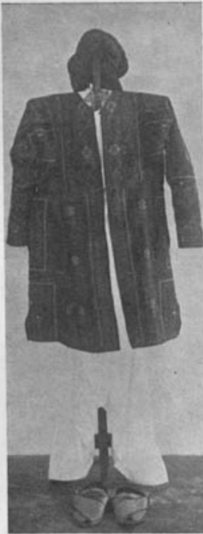
لیاس مردانه بلوچ

با این سبب بود که کشور های متمدن در نیمه دوم قرن نوزدهم بتأسیس موزه های مردم شناسی قیام نمودند زیرا حس کردند که عدم اطلاع بکیفیت زندگی بشوهایا موجب میشود که صنایع و اشیاء متداول بین آنها و همچنین آداب و عادات و صنایع دیگرشان که وقوف بر آنها از لحاظ تاریخ زندگانی بشر فوق العاده مفید و کمال اهمیت را دارد ازین برود و در اینصورت رشته تاریخ زندگانی اجتماع پاره شده نقاط تاریکی در صفحات تاریخ خواهد ماند و نتیجه این علم را دچار ابهام خواهد نمود.