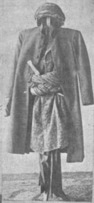
لباس که خدای کر