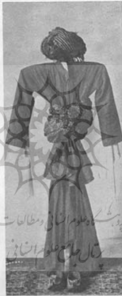
لیاس مردانه سقزی

پس از آن کشورهای دیگر اروپا نیز بشوئه خود به تأسیس موزه مردم شناسی پرداختند و اکنون در اغلب از کشورهای خارجه موزه مردم شناسی موجود و بخوبی اختلاف زندگانی گذشته و حال آنها را نمایش میدهد. چنانکه در تورامبرگ که یکی از شهرهای باویرا است يك موزه علمی مردم شناسی وجود دارد که در آن آثار و نمونه های برجسته ای از زندگانی قوم ژرمن کرد آوری شده و سیر تکامل زندگانی ژرمن ها را از ازمته ماقبل تاریخ تا امروز بشکلی مرتب و مدرج نشان میدهد. مخصوصاً در اغلب کشورهاییکه در سر راه های جغرافیائی