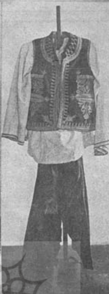
لباس بلوچ ایرانشهر