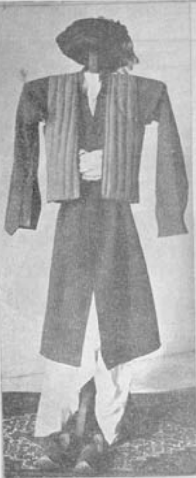
لباس مردانه کوران