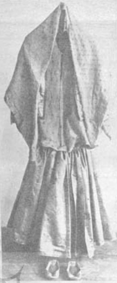
لباس زنانه و باقرین اهری