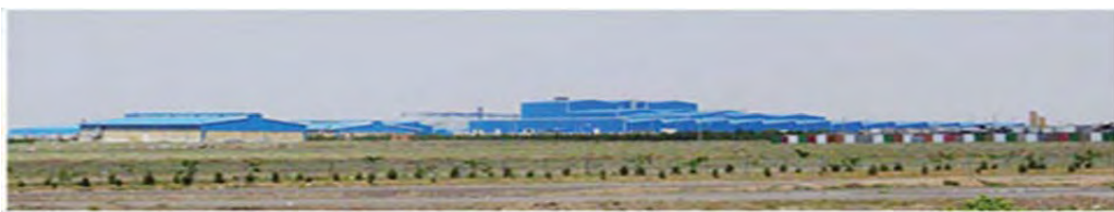
تصویر ۳- مجموعه کارخانجات ایران خودرو در شهر جدید بینالود

هیأت وزیران در جلسه مورخ ۱۳۸۱/۸/۲۹ بنا به پیشنهاد شماره ۱۰۱۵۴۸۰ مورخ ۱۳۸۱/۹/۷ وزارت صنایع و معادن، و به استناد بند (۸) اصلاحی مادهی واحده قانون راجع به تأسیس شرکت شهرکهای صنعتی ایران - مصوب ۱۳۷۶ - تصویب نمود: