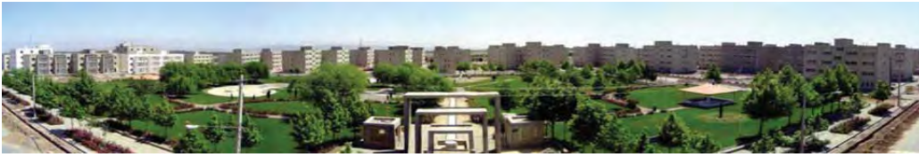
تصویر ۱- نمایی از فاز اول شهر جدید گلپهار

سند ملی توسعه همگی نگاه و توجه خاصی به ایجاد تعادل منطقه‌ای و آمایش سرزمین دارند. بررسی برنامه‌های اول، دوم، سوم و چهارم توسعه نشان می‌دهد که همه برنامه‌ها به امر ایجاد تعادل منطقه توجه داشته و توسعه اشتغال با توجه به استعدادها و منطقه‌ای را از جمله راهکارهای دستیابی به اهداف آمایش سرزمین می‌دانند. از سوی دیگر، اهداف شهرهای جدید که عمدتاً در قالب طرح کالبدی ملی و با هدف ایجاد توزیع متعادل جمعیت و اشتغال در کشور می‌باشند، با سیاستهای برنامه‌های ۵ ساله همخوانی و همسویی داشته و در یک راستا قرار دارند و لزوم توجه به ایجاد اشتغال در شهرهای جدید را به عنوان راهکاری برای استقرار دایم جمعیت و ایجاد عدالت منطقه‌ای در کشور نمایان می‌سازد.