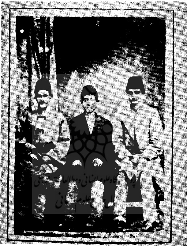
سه تن از شاگردان قدیم دارالفنون