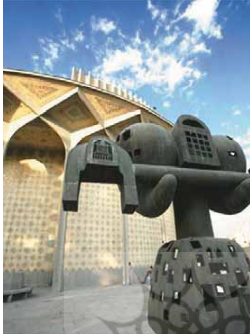
تصویر ۶- فرهاد و قفلپایش، اثر پرویز تناولی، تئاتر شهر