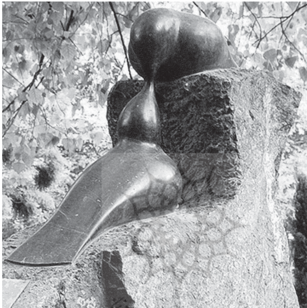
تصویر ۱- دوپرنده، حمید رضا حکیمی، پارک ایرانشهر، مأخذ: حجم های شهری، ۱۳۸۷، ۵۹