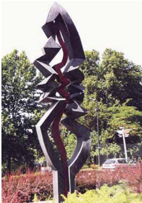
تصویر ۹- یادمان شهید باهنر، اثر سعید شهلا پور، میدان شهید باهنر.