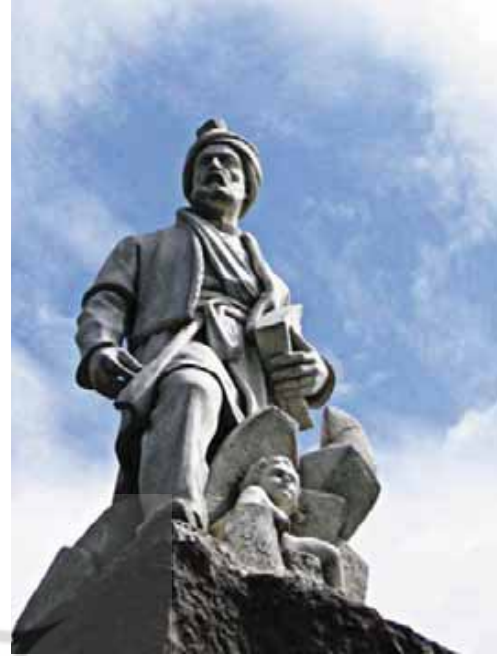
تصویر ۵- فردوسی، اثر ابوالحسن صدیقی، میدان فردوسی ۱۳۸۸

بسیار مهم است. می توان از طریق جمع آوری اطلاعات به امکانات و محدودیت های منطقه مورد فعالیت دست یافت و سپس با کاربرد دقیق از مواد مقاوم در ساخت مجسمه به نتیجه مطلوب رسید. این موارد می تواند شامل دما، رطوبت، شدت و زاویه تابش آفتاب و میزان آلودگی های شیمیایی و به طور کلی شرایط جوی، پایداری خاک ۲ و میزان شیب زمین شود.