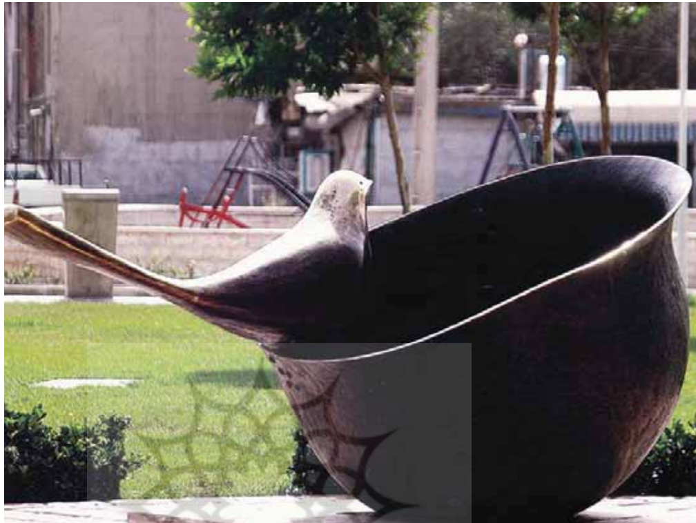
تصویر ۸- یادبود شهید، اثر حسین شناور، فلکه دوم خزانه بخارایی.