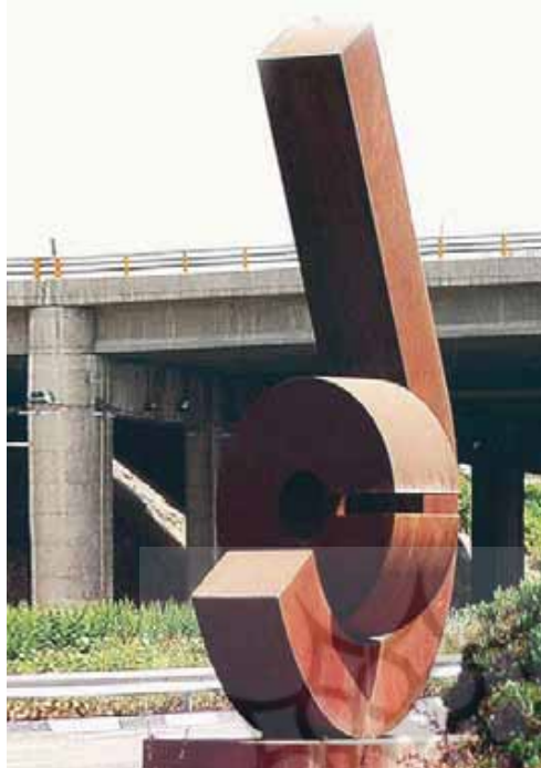
تصویر ۳ - حضرت علی (ع)، اثر داریوش مختاری، بزرگراه امام علی