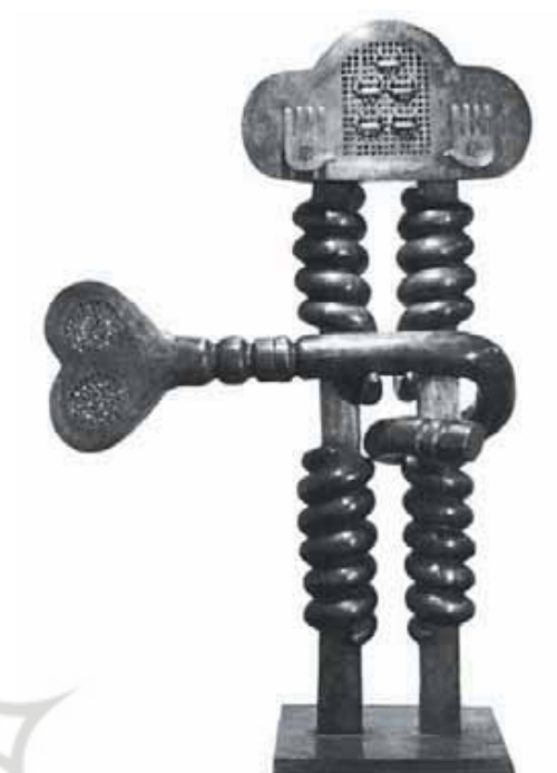
تصویر ۲- تقدیس ۲، اثر پرویز تناولی، پارک ایرانشهر