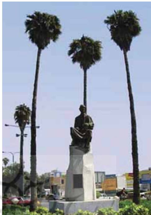
تصویر ۱۰- مولانا، بلوار مولانا، اهواز