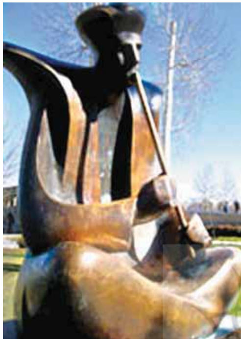
تصویر ۱۱- چوپان نی زن، اثر ملک دادیار گروسیان، اصفهان