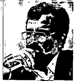
تنها راه برون رفت از این بحران‌های نظری و عملی و ایجاد ثبات لازم برای طی طریق، رشد علوم بومی مبتنی بر مبنای اسلامی و درک شرایط خاص ایران اسلامی است

در این شماره از مجله سوره، موضوع اصلی، تقدیر از روحانی دل‌سوخته‌ای است که سرتاسر وجود او درد دین است و عشق به اصلاح فرهنگ جامعه، سال‌های متمادی است که این عالم فرهیخته و هنرمند، هر هفته از طریق تلویزیون مهمان دل‌های میلیون‌ها بیننده رسانه ملی است.