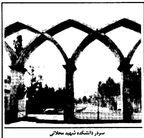
سردر دانشکده شهید مصلحتی

سپاه است. با توجه به محدودیت کمی اعزام روحانیون به مراکز سپاه، تصمیم گرفته شد که بخشی از نیازهای عقیدتی و سیاسی کارکنان سپاه از طریق آموزش کادر خود سپاه تأمین گردد. لذا این دانشکده در شهر قم راه اندازی شد و عزیزان مستعد و علاقه مند، پس از گذراندن دروس عقیدتی و سیاسی لازم در نزد اساتید مجرب حوزه و دانشگاه، از این دانشکده فارغ التحصیل شده و جهت انجام امور فرهنگی و آموزشی به مراکز مختلف سپاه اعزام می گردند.