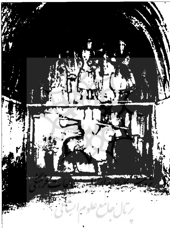
تصویر ۲۰ - بخش داخلی ایوان بزرگ در طاق بستان؛ Id. ۱۹۶۹، طاق بستان، لوحه XXVII

موریس، امپراطور بیزانس از بهرام چوبین غاصب باز پس گرفت و از پناهگاه موقت خود در غرب، در شمال بین النهرین آشور به طرف ایران حرکت کرد. به هنگام مرگ امپراطور، خصومت ها را از سر گرفت و مرزهای امپراطوری خود را به آنسوی مرزهای پیشین در غرب توسعه داد. سرزمین های الحاقی، فرهنگ ها و جمعیت های خارجی تحت کنترل و حاکمیت ساسانی درآمدند. به منظور به زیر کشت بردن سرزمین های جدید و ادامه حیات و آبادانی قلمرو پادشاهی، طرح های عظیم آبیاری در جنوب بین النهرین در منطقه رود دیاله اجرا شد.