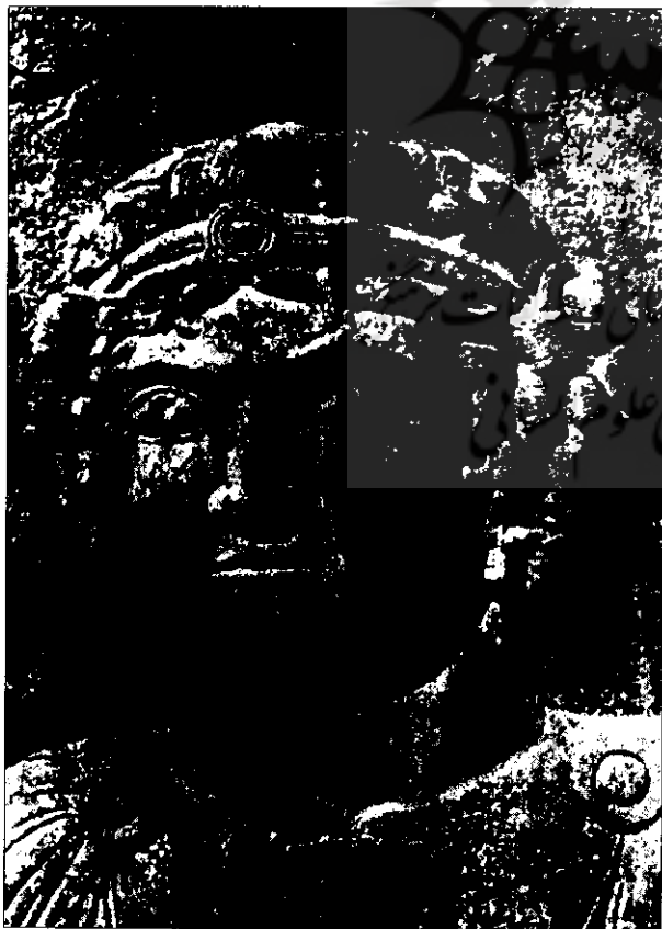
تصویر ۳- جزئیات بیکره بالدار در نمای طاق بستان، ۱۹۶۹، Jd، طاق بستان I، لوحه XX

در تاریخ معماری اسناد و مدارک فراوانی از بناهای مهم با ماهیت قدیمی و سنتی و تأثیر فرم و تزئینات آنها در طی قرون متمادی در دست است که ایوان بزرگ طاق بستان از این قاعده مستثنی نیست. این بنای سلطنتی، نزدیک راه های ارتباطی ایران با سرزمین های همجوار در شرق و غرب، جلوه کاشی جامع چند فرهنگی است که از سنن خاور نزدیک باستان اخذ شده و به منزله پل ارتباطی میان تاریخ چند هزارساله از آغاز تمدن بین النهرین باستان تا اوایل دوره اسلامی و اروپای قرون وسطی محسوب می شود. ۳۷