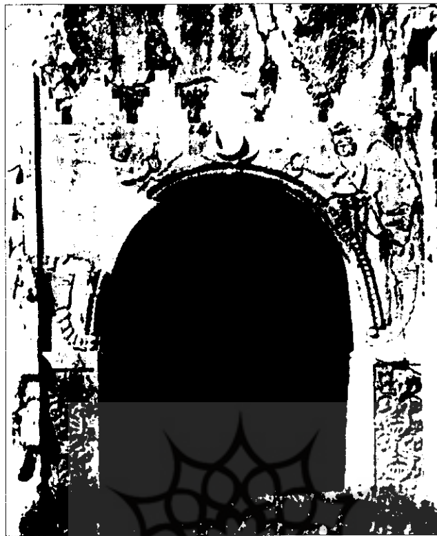
نمای ایوان بزرگ در طاق بستان، س. فوکایی، تصویر ۱۷، توکیو، لوحه ۷، کندهوریوچی، ۱۹۶۹، طاق بستان

انتقال مفاهیم فرهنگی بین النهرین باستان طی چند هزاره به عیلامی ها و بعدها به ایرانی ها پدیده ای است که اسناد و مدارک کافی از آن در طرح ها و نقش مایه های پیکره ای به چشم می خورد. مطالعات بناهای هخامنشی پرسپولیس در