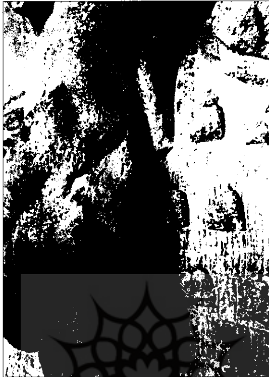
تصویر ۴: جزئیات لباسی که اسب سوار زره پوش به تن دارد، Id. 1977، طاق بستان II، لوحه XIII