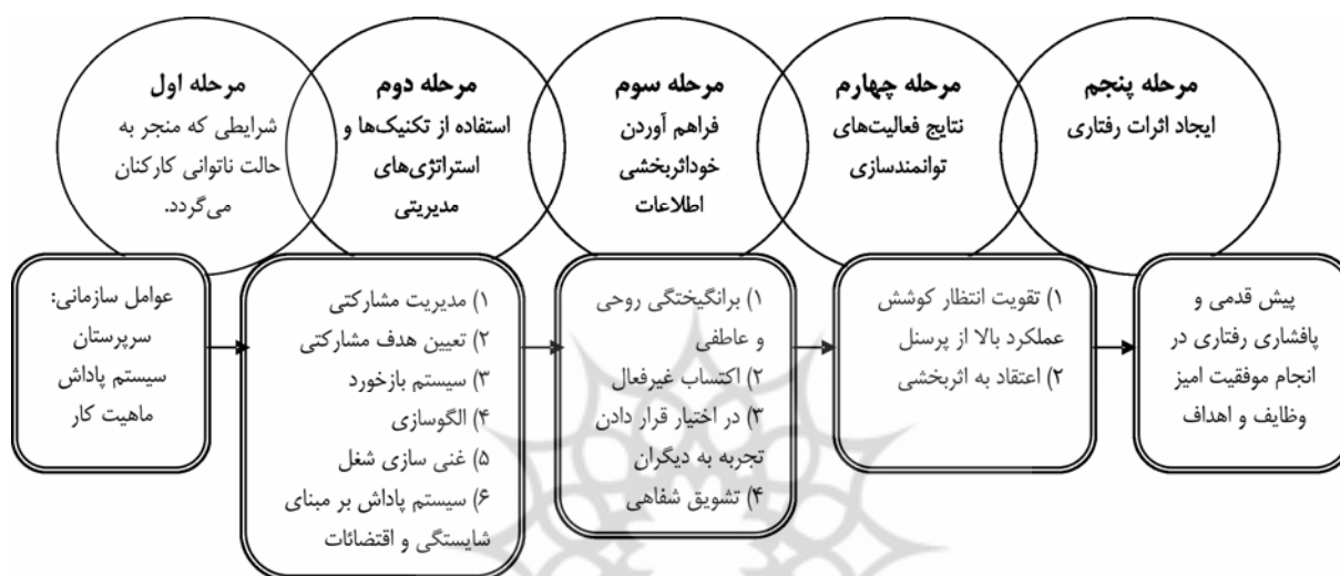
شکل ۱) مدل توان‌مندسازی کانگر و کانونگو (کانونگو، ۱۹۸۸)

را ساده می‌سازند. وقایع و شرایط قابل مشاهده بیرونی به عنوان امور واقعی هستند، اما قضاوت‌ها و رفتارهای افراد درباره وظایف توسط ادراکات که فراتر از واقعیات هستند، شکل می‌گیرند. چنین ادراکات تفسیری فراتر از ادراک‌های واقعیات می‌باشند. بنابراین انگیزش درونی و وظایف و