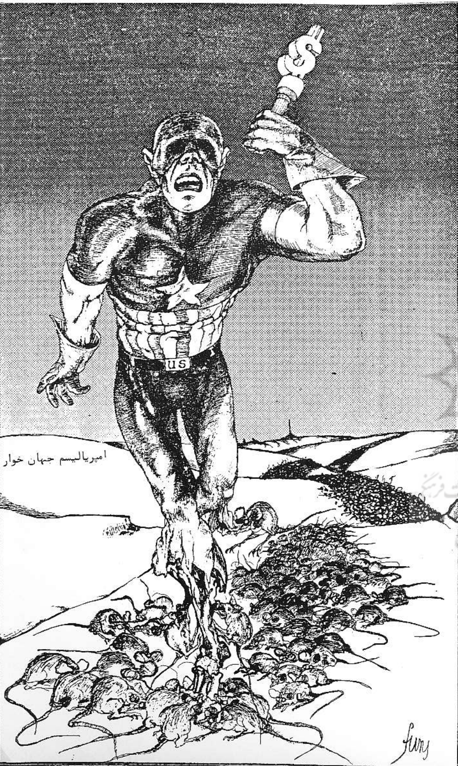
امپریالیسم جهان خوار